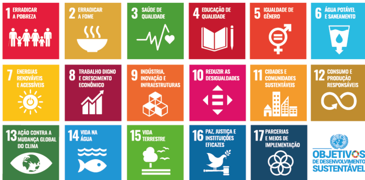
Figura 1 - Objetivos de Desenvolvimento Sustentável

Por isso, a implementação dos ODS em todas as esferas da sociedade é fundamental para alcançar um futuro mais justo, próspero e sustentável. Isso inclui a integração dos ODS em escolas, instituições de ensino, empresas, setor privado, organizações não governamentais (ONGs), comunidades locais e governos, abrangendo diversos setores. Ao trabalhar em conjunto, cada esfera da sociedade pode contribuir de maneira significativa para o alcance dessas metas transformadoras e garantir um futuro mais sustentável para as próximas gerações.