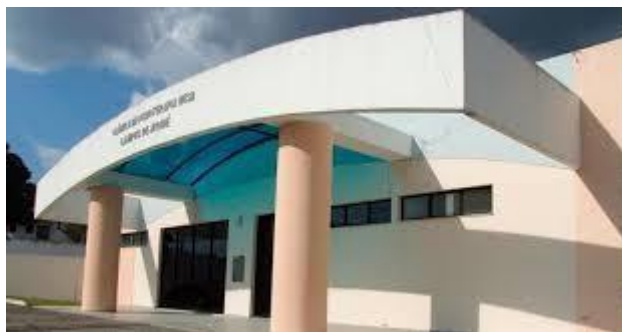
Fig. 4. Clínica Escola de Fisioterapia

Além dos destaques elencados, ressalta-se o incentivo e o apoio do Núcleo Docente Estruturante do Curso de Fisioterapia e da Comissão de Reformulação Curricular.