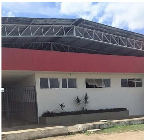
Fig. 1.: Ginásio de Esportes

Segue, portanto, a lista atualizada de encaminhamentos apresentada no relatório de 2018: