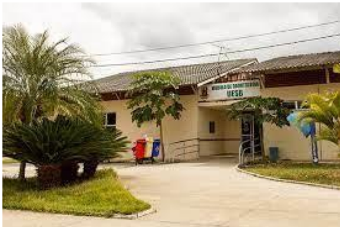
Fig. 2. Módulo de Odontologia

Prado Valadares, Unidades de Saúde da Família, abrigos de crianças e adolescentes, escolas municipais para as disciplinas de Saúde Coletiva I, II, III, IV e V e Clínica Odontopediátrica I.