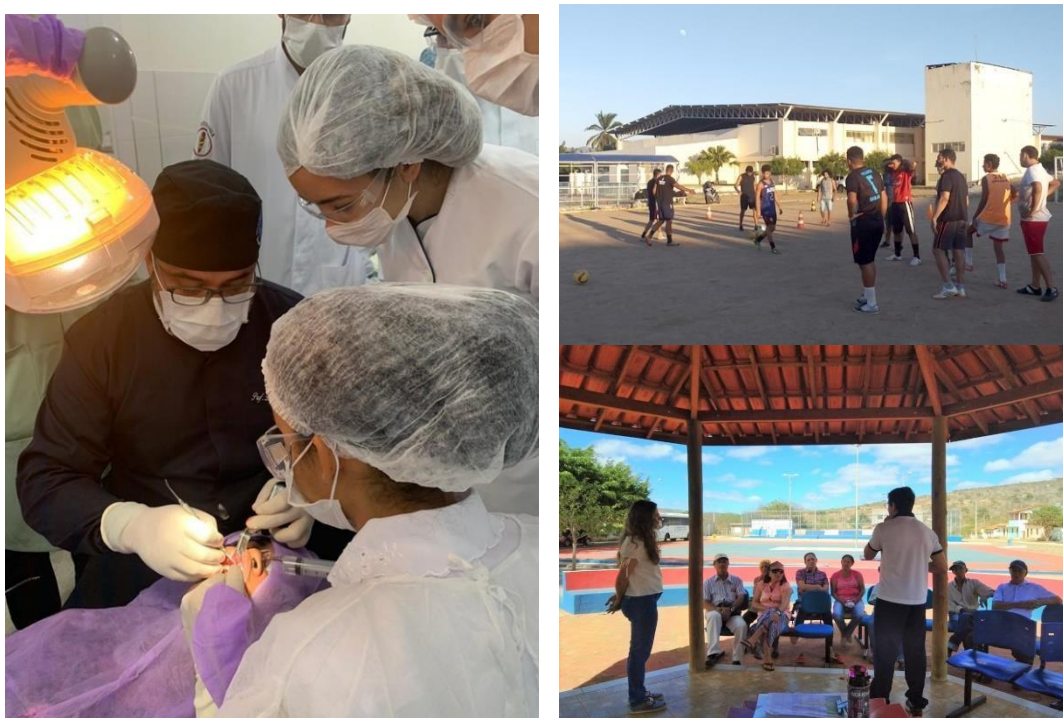
Fig. 5: Projetos: Lesões orofaciais: prevenção e promoção de saúde oral, Escola de Futebol da UESB, Promoção do conhecimento das condições de saúde em indivíduos que sofreram a exposição ocupacional ao amianto em Bom Jesus da Serra-BA (da esquerda para direita).