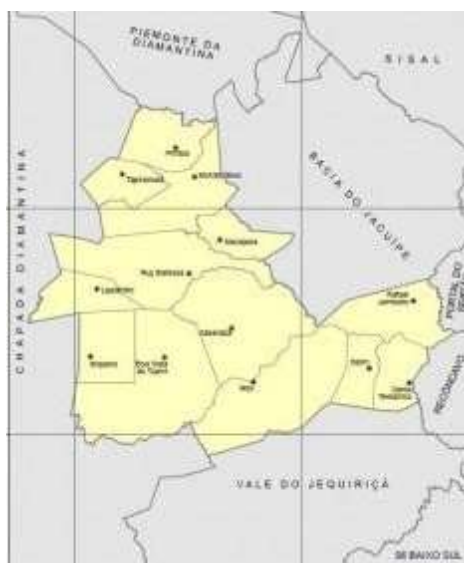
Figura 1 – Mapa do Território de Identidade Piemonte do Paraguaçu