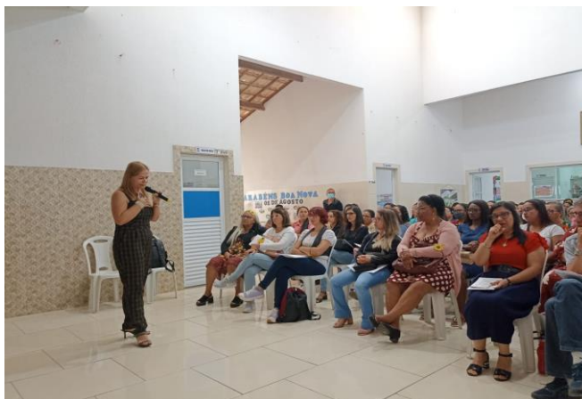
Figuras – Círculos de Diálogo em Bom Jesus da Lapa