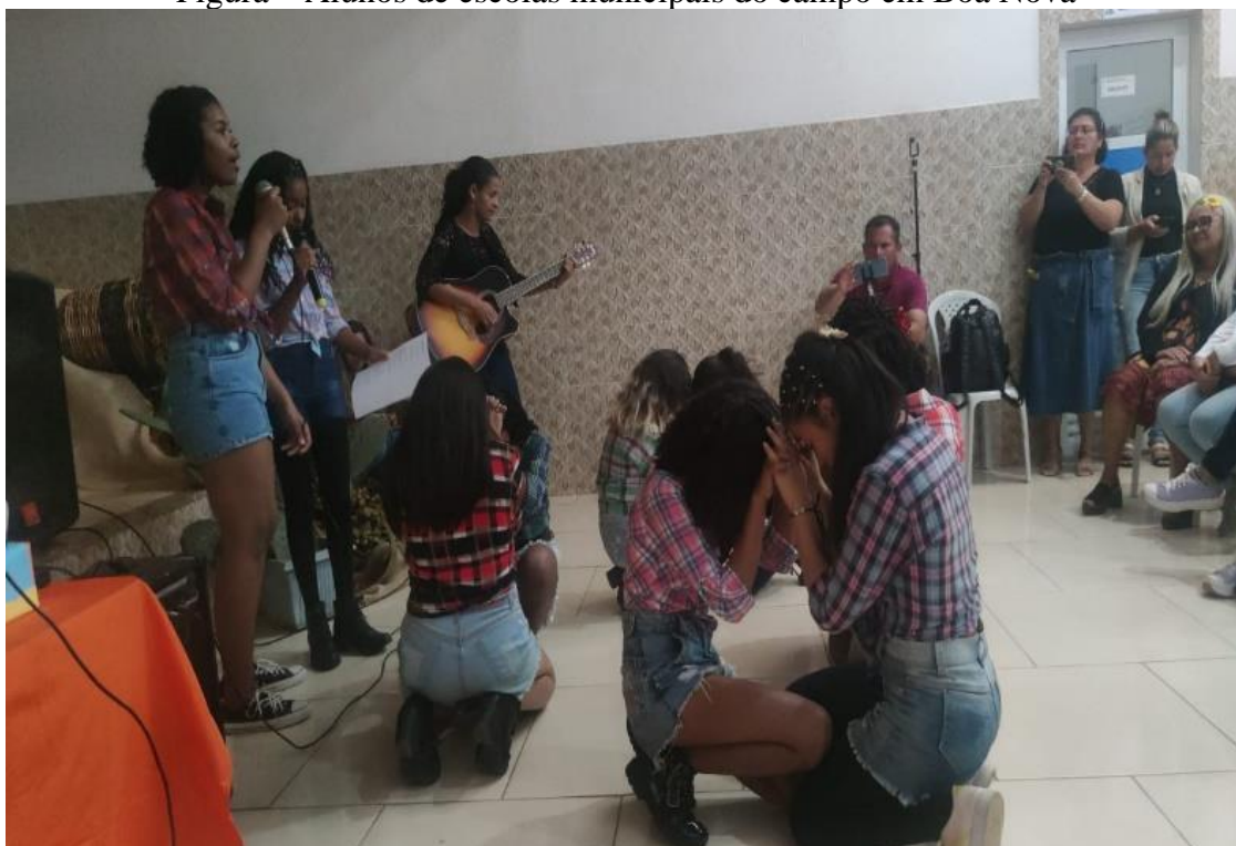
Figura – Alunos de escolas municipais do campo em Boa Nova

Apresentações de místicas realizadas pelos alunos do campo nas atividades de formação continuada