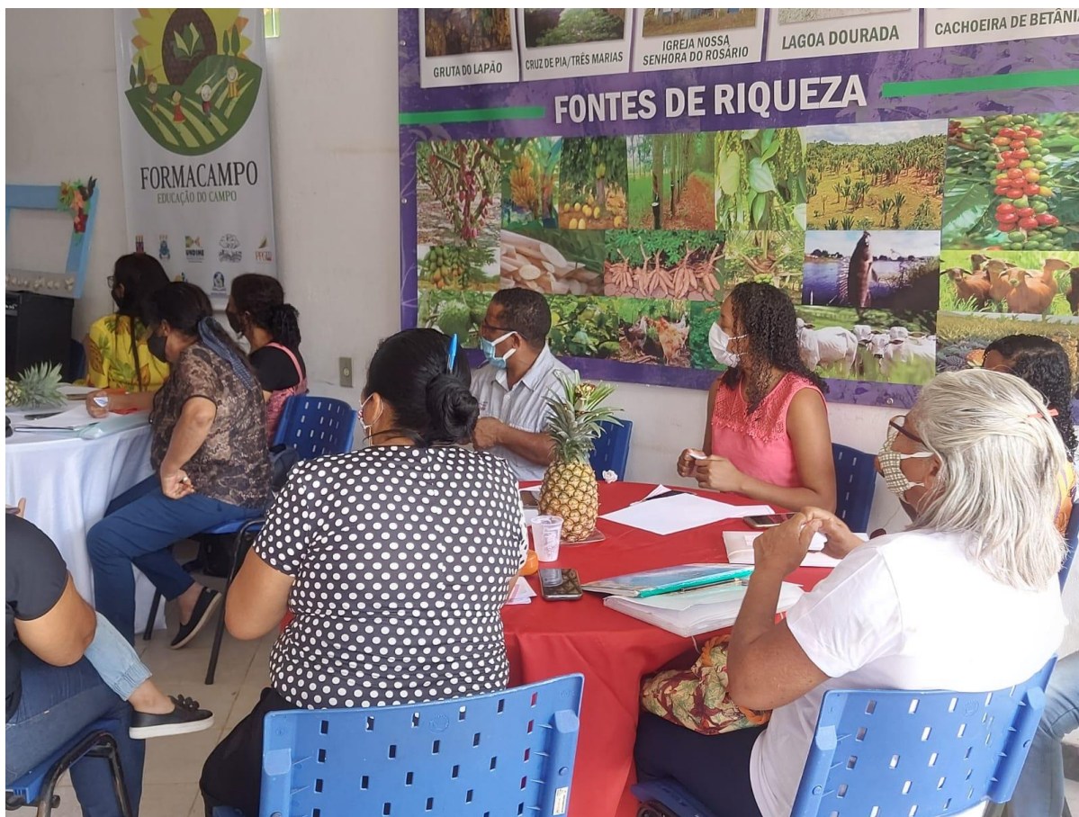
Figura – Formação sobre PPP em Laje e Firmino Alves