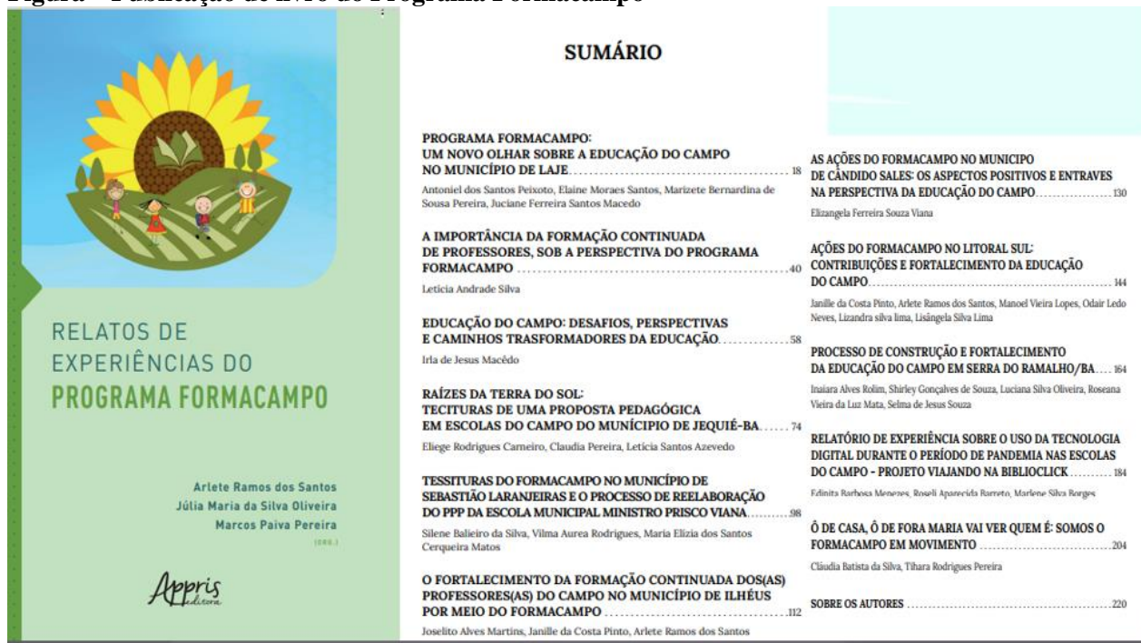
Figura – Publicação de livro do Programa Formacampo

Sobre a produção científica, destacamos a publicação de um livro, a escrita de vários capítulos de livro, e também, a publicação de artigos em periódicos e em anais de evento.