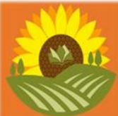
Figuras – Apresentações de alunos de escolas do campo de Anagé.