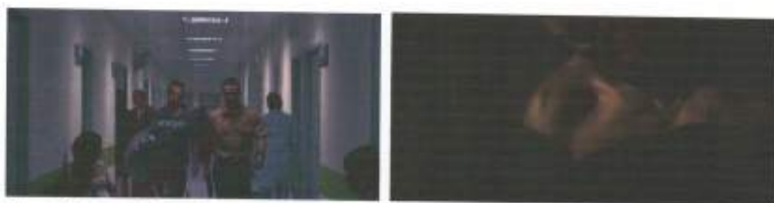
Figura 25: frames de Praia do Futuro (2014)

Ao contrário dos filmes anteriores, Praia do Futuro e Jongens não apresentam a desconstrução da indumentário, muito pelo contrário, vai mais além e revelam os sujeitos apenas pelos seus corpos nus. No primeiro, a sequência que antecede e contextualiza a relação sexual se passa dentro de um hospital. Donato e Konrad estão usando suas vestimentas viris, o fardamento completo de bombeiro e a roupa de motociclista. Quando o plano é cortado e a montagem nos leva para outro, o do sexo, os personagens estão nus, enclausurados dentro de um carro. O rosto de Donato, inclusive, não pode nem mesmo ser visto, pois toda vez que ele tenta levantar o seu rosto é impedido por Konrad que no papel de penetrador do ato sexual impinge sua força sob a cabeça parceiro (figura 25). Formação semelhante acontece no plano em Jongens , quando os dois adolescentes se beijam não temos nenhum traço de seu fardamento anterior composto por short e camisa azul do uniforme da equipe de corrida. Como falei mais a cima, nem mesmo seus rosto aparecem.