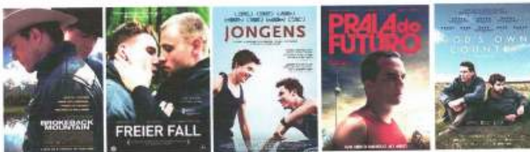
Figura 1: Capas dos filmes Brokeback Mountain , Freier Fall , Jongens , Praia do futuro e God's Own Country .