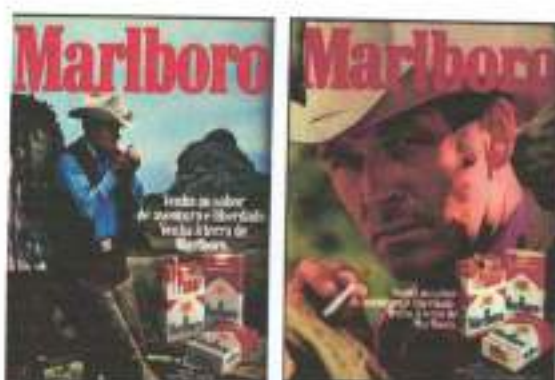
Figura 5: Campanhas publicitárias Marlboro, 1975 e 1976.