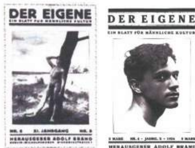
Figura 5: Revista Periódica "Der Eigene". Edições nº 4 e 8. Alemanha, 1924

Se formam então dois lugares antagônicos na imagem das 'homorepresentações': a feminilidade e a masculinidade.