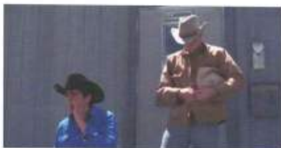
Figura 12: frame de Brokeback Mountain (2005)

da lei física, social e moral”. Nesse sentido o discurso de dianteira, protagonismo e virilidade desses sujeitos é proporcionado não por uma corrida, mas uma estática. A câmera fixa (figura 12), retomando a imagem do cowboy do western , presente nas campanhas de cigarro. O cinema nos impede de não observar a postura viril e controlada de nossos protagonistas, mesma postura calculada necessária para se estar à frente de uma corrida.