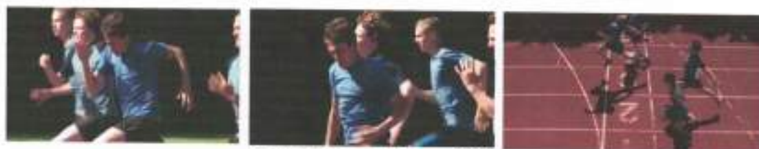
Figura 11: frames de Jongens (2014)