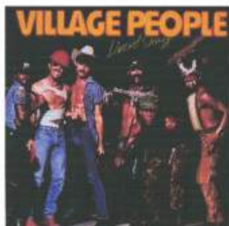
Figura 9: Village People - capa do Album Live and Sleazy .