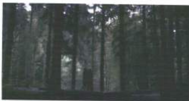
Figura 22: frame de Freier Fall (2014)

Mesma estratégia audiovisual é empregada em Freier Fall , quando Kay e Marc estão finalmente dentro da floresta, distante do alojamento de formação policial, o audiovisual introduz a primeira troca sexual dos personagens. A sequência utiliza da montagem das imagens de Primeiríssimo Plano (PPP), Primeiro Plano (PP), PM (em plano e contra-plano) e Planos Gerais para mostrar a realização sexual. A cena em questão se trata de uma tentativa de troca afetiva por parte de Kay , que resulta em uma masturbação travada e abrupta devido ao medo e a resistência de Marc . Quando as demonstrações de prazer se iniciam, a imagem apresenta um plano aberto em contra-plogée , as estratégias audiovisuais mais uma vez garantem a ideia de um olhar para a paisagem ao emoldurarem o plano com um tronco de árvore caída no canto inferior do quadro. Temos um “apagamento da marca primeira de identidade do sujeito que foi ao longo do tempo marcado pelo seu rosto” (MILANEZ, 2009, p. 217). A silhueta dos homens se mistura com a das árvores, fazendo com que os sujeitos e as ações se dispersem na verticalidade da vegetação (figura 22).