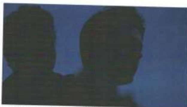
Figura 29: frame de Jongens (2014)

Esse diálogo encerra a cena que corta para o menino pegando a moto de seu irmão e disparando. Seguido disso temos um plano sequência de Sieger e Max juntos, abraçados, andando de moto. (figura 29)