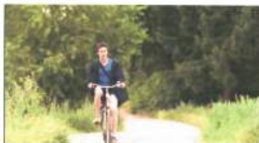
Figura 18: frames de Jongens (2014)

floresta para terem uma troca sexual. Tanto a sequência de Jongens , quanto a de Freier Fall , enunciam o lugar distante das campos abertos e das paragens vazias como apagamento cotidiano. (figuras 18 e 19)