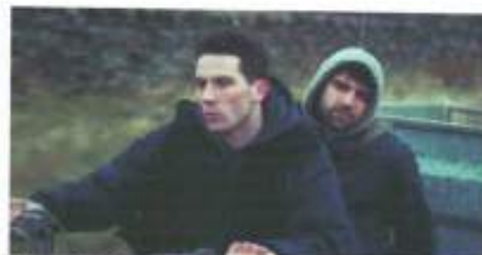
Figura 17: frame de God's Own Country (2017)

Já em Jongens , Sieger e Marc se juntam a um grupo de amigos da equipe de corrida e vão juntos tomar banho em um lago relativamente próximo do ginásio em que são apresentados. Aqui o rompimento com o urbano cotidiano é ainda mais marcante, pois o deslocamento se dá repetidamente. Inicialmente o grupo de jovens se desloca até lá, mas em determinado momento da narrativa os companheiros dos protagonistas decidem ir embora, Sieger vai com eles deixando Marc sozinho à beira do lago. Porém, enquanto faz seu percurso de retorno para casa, Sieger decide voltar para o lago, pela segunda vez, permanecendo longe da realidade governada. Dessa vez os dois se veem, de fato, sozinhos e afastados. Em Freier Fall , a ida para o desconhecido também acontece em dois blocos. Os personagens Kay Engel e Marc Borgmann , já estão isolados de seu cotidiano urbano e familiar por estarem reclusos dentro da academia de formação policial, que se apresenta relativamente afastada. Eles estão longe do cotidiano urbano, porém inclusos dentro de um espaço de governo populado que é o corpo policial. O audiovisual apresenta os personagens praticando corrida em um trilha estreita que os leva para uma floresta muito fechada. O afastamento para a introdução da sexualidade se dá em dois momentos. O primeiro é quando um beijo roubado por Marc acontece, porém Borgmann se assusta e vai embora. O segundo momento é quando, propositalmente, os dois se encontram na