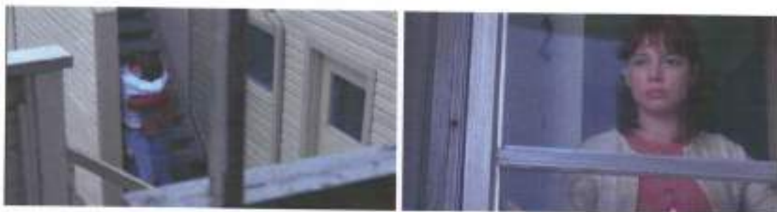
Figura 27: frames de Brokeback Mountain (2005)

Esse flagra dos afetos é sem dúvida o nosso segundo plot narrativo, é a ação climax , o ponto alto do conflito da sexualidade. Em Brokeback Mountain , depois de alguns anos sem se verem, se casarem com uma mulher e constituírem família, Jack e Ennis finalmente se reencontram. O encontro dos dois acontece na entrada da casa de Ennis. No momento do encontro, os dois trocam um acalorado beijo e nesse momento são flagrados por Alma, companheira de Ennis, interpretada por Michelle Williams. A sequência é um plongée , que é um raccord de olhar (quando a câmera assume o ponto de vista do personagem em cena) da mulher que vê catatônica o beijo pela janela da cozinha (figura 27).