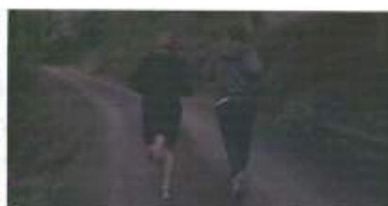
Figura 19: frames de Freier Fall (2013)

Praia do Futuro apresenta o afastamento de forma ainda mais singular. O personagem de Donato é bombeiro salva-vidas, sendo assim o espaço natural da praia já faz parte do cotidiano de doutrinação do seu corpo viril; já Konrad , é um turista alemão que está de passagem por Fortaleza - CE, assim sendo ele já está em condição de afastamento. Nesse quadro, o afastamento se apresenta não para um espaço campestre, natural ou praiano, mas literalmente como uma saída da cidade, de seu país. Quando os dois tem a primeira experiência sexual juntos saem da normalização urbana e se apresentam diante de suas sexualidades em uma beira da estrada, distante da cidade. O filme de Karim Aïounz, traz uma estética muito forte, sua montagem tem um corte seco, com saltos de situação. O deslocamento físico dos personagens, nesse escopo, é mostrada não com uma sequência de saída, mas com um corte abrupto de uma cena de hospital, onde em travelling a imagem mostra Donato oferecendo uma carona para Konrand, seguida de um corte para a relação sexual dos dois em o espaço apertado e desconhecido do carro, em seguida se dá outro corte e vemos em Plano Geral (PG) de câmera fixa a apresentação de um carro parado no encostamento de uma encruzilhada (figura 20), estão afastados da cidade.