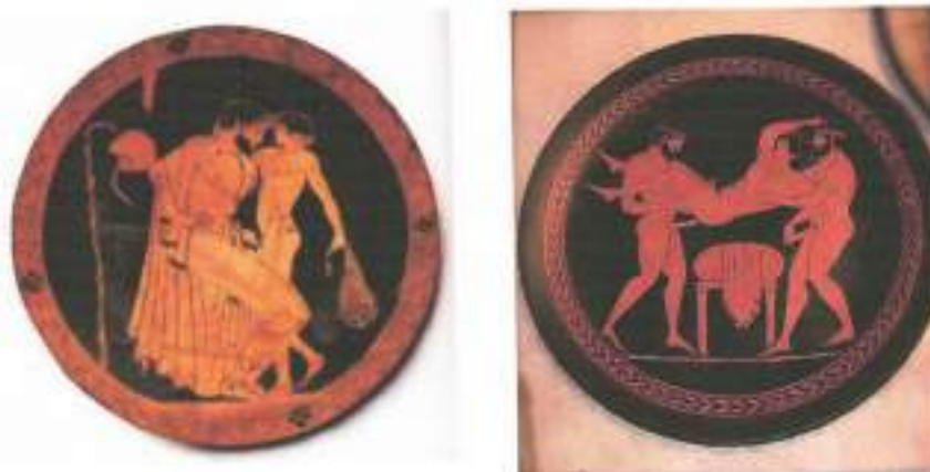
Figura 4: Pinturas em vasos cerâmicos. Grécia, período Clássico; S/D.

penetrado, ativo e passivo, dominador e dominado de modo a criar um regime de valor para os envolvidos. Sendo assim, “qualquer atividade sexual onde um homem penetrasse um inferior social seu era tida como normal, enquanto ser penetrado por este, era considerado potencialmente vergonhoso” (ALVES, 2016; s/p). O que se fez funcionar para aquela época foi um regime onde o vigor sexual para ser valorado deveria colocar o homem em lugar de superioridade, lugar assumido pela penetração. O penetrado, estaria ou no lugar de aprendiz, ou no lugar de vergonha, de comportamento inverso ao da masculinidade. Nessas relações não eram empregados os lugares de repressão que funcionam hoje, embora respondessem a uma temperança de comportamento. Prova disso são as pinturas cerâmicas (figura 4) que apresentavam a relação entre homens. O interessante para a análise é observar como os corpos aparecem representados. A morfologia corporal dos sujeitos marca a hierarquia tratada, evidente na presença da barba e das vestimentas sob o corpo musculo versus corpos menores, sem barba, mas ainda com músculos desenhados.