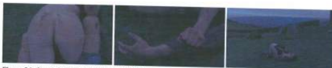
Figura 24: frames de God's Own Country (2017)

mostrar as luzes da cidade, ao fundo (figura 24). Essa apresentação das imagens é feita de modo a mostrar a violência animalésca que os dois empregam ao ato sexual. Na primeira formação temos a exibição de recortes do corpo dos sujeitos-personagens que “embasam a morfologia de uma identidade corporal determinada por apagamentos” (MILANEZ, 2009; p. 217), na segunda, temos, mais uma vez, o posicionamento da prática sexual entre homens integrada a imagem na relação corpo-espço.