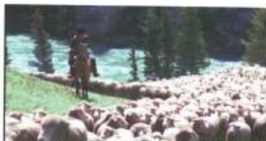
Figura 16: frame de Brokeback Mountain (2005)

calado que se dedica ajudar, de mau grado, o pai debilitado e a avó nos cuidados da fazenda em que eles moram. É com a chegada de Gheorghe Ionesco , romeno misterioso, para trabalhar nas atividades da fazenda, que eles se deslocam para um ponto distante da fazenda com a função de arrumarem uma cerca quebrada. Lá eles passam cerca de quatro dias sozinhos, afastados de qualquer civilização, tendo apenas os grandes campos cercados por planaltos como companhia. O audiovisual faz questão de apresentar esse deslocamento em imagem. Nos frames (figuras 16 e 17) vemos os quatro rapazes se deslocando em seus cavalos e seus quadriciclos.