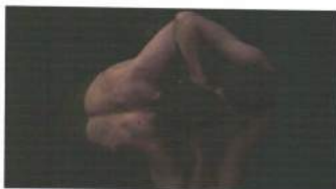
Figura 23: frame de Jongens (2014)

Em Jongens , o nível de integração corpo-espço é ainda mais carregada. Assim que estão finalmente sozinhos no lago em que foram com os colegas, Sieger e Marc, nadam e brincam nas águas, até que em determinado momento, quando se apoiam em um tronco que boia, o afeto acontece. Os rapazes trocam um beijo singelo. A afeição entre os rapazes é mostrada por meio de um plongée total, 90°. A composição da cena se dá na centralidade do tronco que mantem os rapazes em lados específicos da imagem. Os sujeitos-personagens são mostrados de cima, impedindo a identificação de quem é quem, aliado à isso, o modo como os corpos sem camisa emergem na água e são desenhados por ela evocam a ideia de que um é o espelho do outro (figura 23). Uma dispersão dos sujeitos no enfrentamento de si mesmos diante de suas próprias sexualidades nas profundezas do espaço, mas que acende “a chama de uma posição censuradora para a prática afetiva do beijo entre homens” (MILANEZ, 2014a; p. 267).