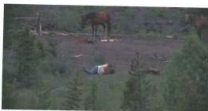
Figura 21: frame de Brokeback Mountain (2005)

Mesma estratégia audiovisual é empregada em Freier Fall , quando Kay e Marc estão finalmente dentro da floresta, distante do alojamento de formação policial, o audiovisual introduz a primeira troca sexual dos personagens. A sequência utiliza da montagem das imagens de Primeiríssimo Plano (PPP), Primeiro Plano (PP), PM (em plano e contra-plano) e Planos Gerais para mostrar a realização sexual. A cena em questão se trata de uma tentativa de troca afetiva por parte de Kay , que resulta em uma masturbação travada e abrupta devido ao medo e a resistência de Marc . Quando as demonstrações de prazer se iniciam, a imagem apresenta um plano aberto em contra-plogée , as estratégias audiovisuais mais uma vez garantem a ideia de um olhar para a paisagem ao emoldurarem o plano com um tronco de árvore caída no canto inferior do quadro. Temos um “apagamento da marca primeira de identidade do sujeito que foi ao longo do tempo marcado pelo seu rosto” (MILANEZ, 2009, p. 217). A silhueta dos homens se mistura com a das árvores, fazendo com que os sujeitos e as ações se dispersem na verticalidade da vegetação (figura 22).