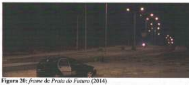
Figura 20: frame de Praia do Futuro (2014)

Praia do Futuro apresenta o afastamento de forma ainda mais singular. O personagem de Donato é bombeiro salva-vidas, sendo assim o espaço natural da praia já faz parte do cotidiano de doutrinação do seu corpo viril; já Konrad , é um turista alemão que está de passagem por Fortaleza - CE, assim sendo ele já está em condição de afastamento. Nesse quadro, o afastamento se apresenta não para um espaço campestre, natural ou praiano, mas literalmente como uma saída da cidade, de seu país. Quando os dois tem a primeira experiência sexual juntos saem da normalização urbana e se apresentam diante de suas sexualidades em uma beira da estrada, distante da cidade. O filme de Karim Aïounz, traz uma estética muito forte, sua montagem tem um corte seco, com saltos de situação. O deslocamento físico dos personagens, nesse escopo, é mostrada não com uma sequência de saída, mas com um corte abrupto de uma cena de hospital, onde em travelling a imagem mostra Donato oferecendo uma carona para Konrand, seguida de um corte para a relação sexual dos dois em o espaço apertado e desconhecido do carro, em seguida se dá outro corte e vemos em Plano Geral (PG) de câmera fixa a apresentação de um carro parado no encostamento de uma encruzilhada (figura 20), estão afastados da cidade.