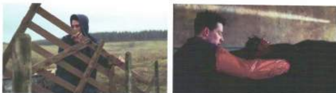
Figura 15: frames de God's own Country (2017)

Por fim, no britânico God's Own Country (2017), de Francis Lee, nos primeiros minutos de filme tomamos conhecimento da rotina de Johnny Saxby, personagem de Josh O'Connor. O rapaz é responsável pela fazenda de seus pais, por meio de uma montagem com cortes secos, entendemos que é ele o responsável por cuidar de trabalhos de carpintaria e de trato dos animais (figura 14). O vemos reforçando uma cerca, limpando um curral e inseminando uma vaca. Temos aí o lugar do “fazer de homem”, trabalhos manuais, de força, um lugar que foi dado ao homem e que o confere essa virilidade social.