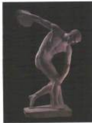
Figura 2: "O Discóbolo" de Myron.

A obra de Myron garante o estatuto viril ao “mostrar a estrutura do corpo — suas principais articulações [...], ossos e músculos, e a formar uma imagem convincente da figura” (GOMBRICH, 1999; p. 45) masculina no ápice de suas capacidades corporais na força da práxis. A visibilidade das formas no nú nos ajuda a “compreender e decifrar o corpo por meio de seus signos, ou seja, suas pistas, traços e sinais dentro do quadro de uma perspectiva de identificação” (MILANEZ, 2012; p. 86), onde o que emerge na história dos homens é o vigor corporal de forma imagética “explorando a anatomia dos ossos e músculos, e ao formar uma imagem convincente” (GOMBRINCH, 1999; p. 45), garantindo e reverberando um discurso do necessário viril corporal em “visibilidades que enquadram os sujeitos em uma sociedade regulada pela norma da arte de bem apresentar-se” (MILANEZ, 2012; p. 82/3).