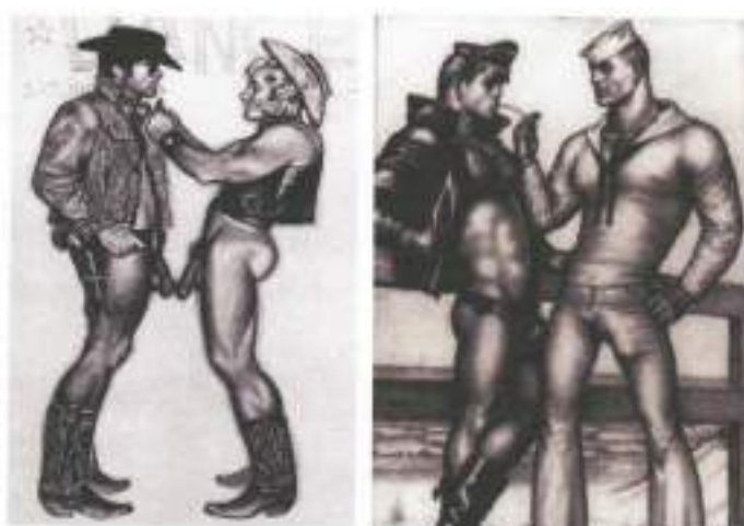
Figura 8: Desenhos de Tom Of Finland, 1950.

É esse ideal de masculinidade, tanto antigo quanto moderno, que a homossexualidade fez uso desvinculando-se do lugar da feminilidade na mídia. Tomando um discurso amplo que rege a subjetividade masculina e a levando a níveis mais extremos. Na década de 50, os desenhos de Touko Laaksonen (1920-1991), conhecido como Tom of Finland , aparecem nos trazendo uma erótica para o sujeito gay. Seus desenhos homoeróticos exaltavam a virilidade por meio de marcas corporais. Os caps , as vestimentas de cowboy, policial, bombeiro, marinheiro e operário, assim como as fantasias de couro, se atrelavam aos bigodes e barbas bem desenhados, as poses 'de homens' e ao pênis e músculos bem demarcados na peças justíssima (figura 7).