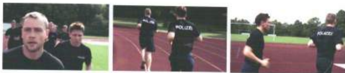
Figura 10: frames de Freier Fall (2013)