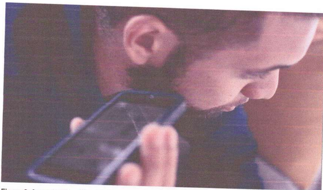
Figura 6: frame do Filme Chega Mais . Câmera precisa estar próxima ao personagem para captar o áudio com clareza)

Em planos próximo ou close-up , as cenas tem relação mais com a captação dos diálogos, pois como os recursos de gravação de áudio eram limitados, usando apenas o microfone da câmera para gravar o som direto. Foi também uma técnica de camuflagem para transformar a câmera em algo comum ao personagem, pois ao manter a câmera sempre próxima, deixou de ser algo estranho e a naturalidade do personagem assumiu seu lugar outra vez. Isso fez o filme criar uma relação de intimidade do espectador com o personagem.