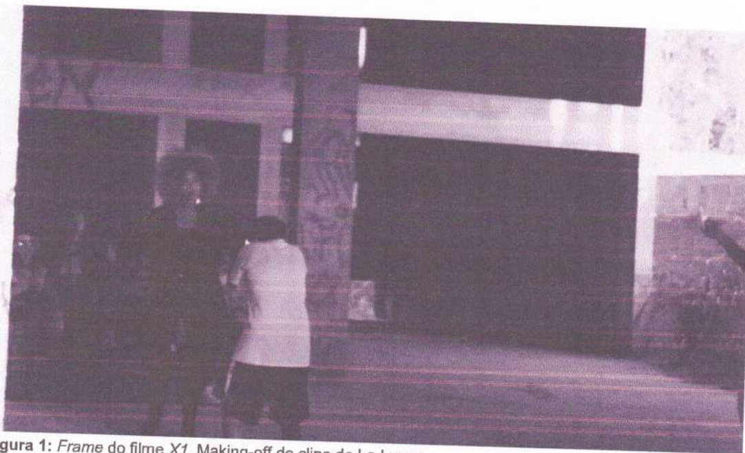
Figura 1: Frame do filme X1 . Making-off do clipe de La Lunna.

ficasse semelhante a um making-off de clipe, já que a maioria de nossas imagens eram dos dias que acompanhamos os bastidores das produções e ainda precisaríamos mostrar trechos dos videoclipes prontos tendo em vista que estes são o principal meio de divulgação dos artistas escolhidos. Durante as gravações do clipe "Sem Massagem", tivemos que concentrar nosso olhar nos preparativos da produção e da direção de arte, isso fez com que X1 fosse construído basicamente por imagens de arquivo, o que o caracterizava como um making-off . Foi importante ter feito o X1 na definição da estética do nosso documentário, pois essa questão ainda estava muito vazia e a partir dele começamos a perceber algumas necessidades exigidas pelo processo. Apresentando o primeiro exercício, foi discutido a estética e pedido pelo orientador um segundo material editado, agora de 3 minutos, X2 .