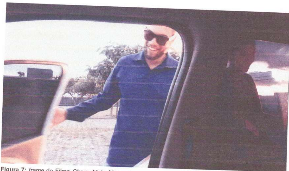
Figura 7: frame do Filme Chega Mais . Momento em que Ruan abre a porta do carro, rompendo com o silêncio do filme.

Ainda na época do cinema mudo a música já cumpria um papel importante na dramaturgia dos filmes, quando uma orquestra acompanhava as cenas por trás da tela, os “cantores se posicionavam atrás da tela para acompanhar as imagens de revistas musicais e operetas filmadas” (CARVALHO, 2009; p. 1), como relata Marcia Carvalho.