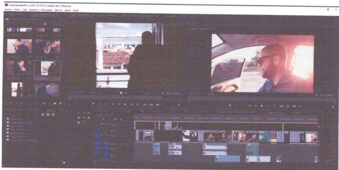
Figura 8: Print da timeline do programa Adobe Premiere no projeto do filme Chega Mais