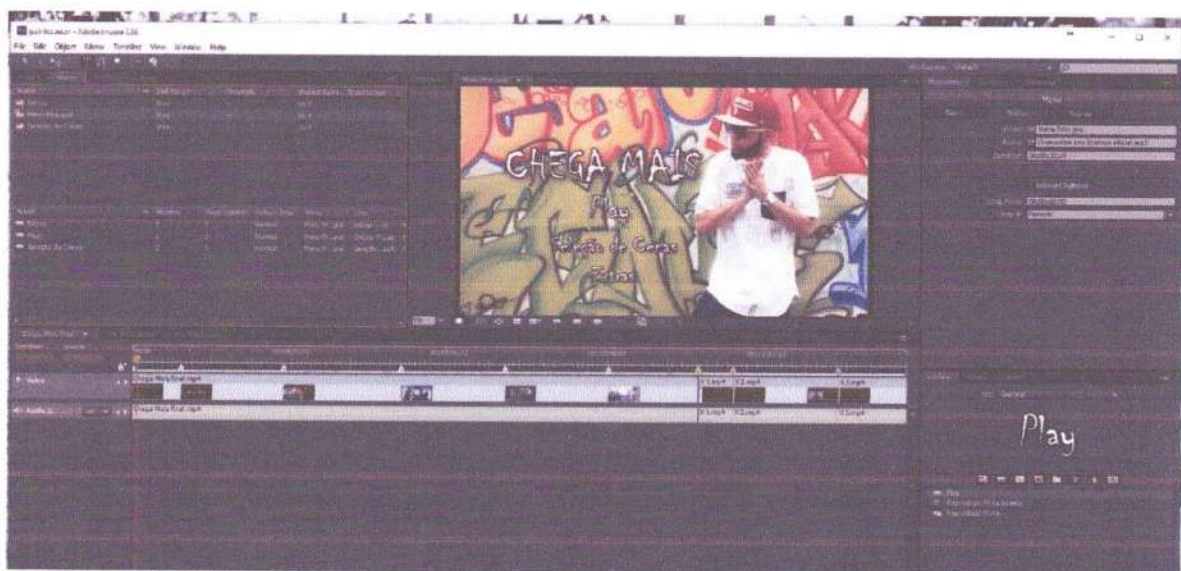
Figura 9: Print da timeline do programa Adobe Encore CS6 no projeto do menu do filme Chega Mais