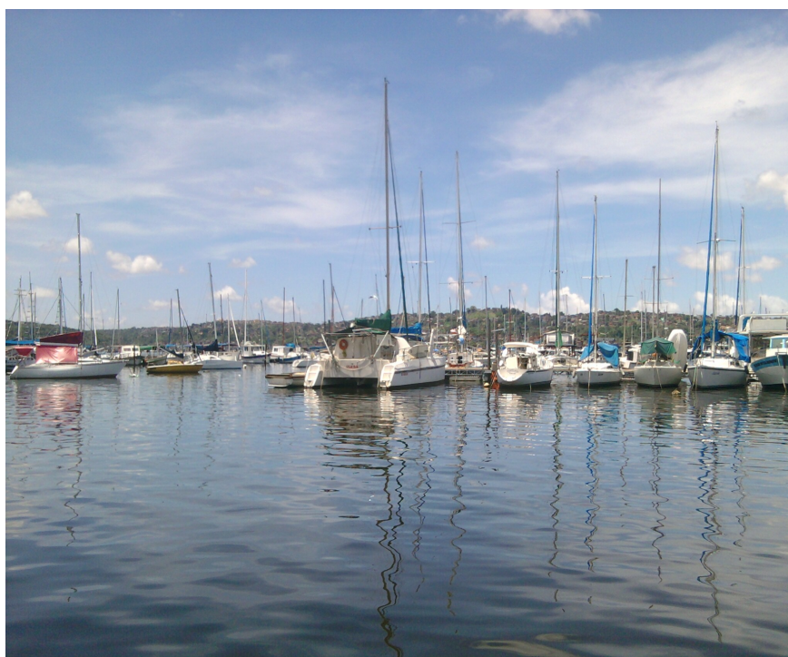
Figura 3: Porto dos Tainheiros na Ribeira. Grazy Lima, 2015

ser capital. Salvador é uma cidade agitada, acho que se tivesse que descrever a cidade em um nome, diria carnaval. Porque aquilo ali é um furdunço sem parar. E aí você está naquele corre corre, parecendo um dançarino de axé, descendo e subindo, sem parar e chega na Ribeira. Parece que você chegou em uma outra cidade, muitos dizem até que é como estar no inteiro, só que melhor ainda, já que tem vista para o mar (figura 03).