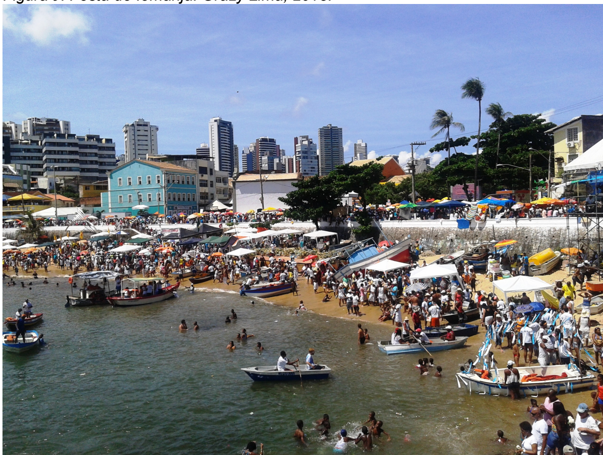
Figura 5: Festa de Iemanjá. Grazy Lima, 2015.

Enquanto pessoas enfrentam uma fila gigantesca para colocar suas oferendas nos pés da mãe, que serão levadas as quatro da tarde pelos barcos dos pescadores até alto mar, outras se divertem bebem, comendo, cantando e dançando com um grande número de barraquinhas, restaurantes e bares. As festas de camisas e open bar também marcam presença, oferecendo comida e bebida de graça, mais show com bandas populares na cidade.