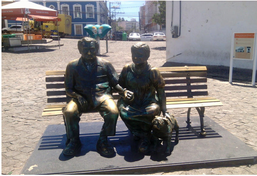
Figura 4: Escultura de Jorge Amado e Zélia Gattai no Largo de Santana. Grazy Lima, 2015

O bairro onde nasce Salvador é o principal cenário do roteiro, onde esta localizada a Casa de Iemanjá e onde acontece todo ano no dia dois de fevereiro a festa em homenagem a orixá, extremamente popular. As ruas do Rio Vermelho são tomadas por uma multidão neste dia. Quando mais próximo da praia da Paciência você chega mais a multidão aumenta. Pessoas dos mais variados tipos, você encontra aqueles que tem fé, que seguem a religião, encontra aqueles que aparecem para prestar seus respeitos e fazerem pedidos apenas uma vez no ano, outros vão apenas pela festa e assumem.