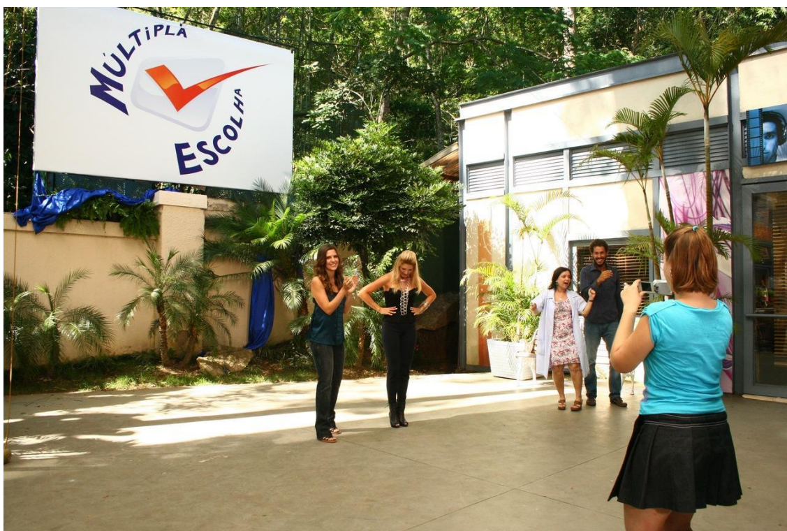
Figura 5 - Colégio Múltipla Escolha na novela “Malhação”

De forma geral, as produções com tal temática tratam dos mesmos assuntos, com seus diferentes enfoques e abordagens. Amizade, responsabilidade, sexo, uso e abuso de drogas, gravidez e aborto, sexualidade, amor, conflito de gerações. A escola é um pano de fundo muito comum, o fator que une e reúne as personagens principais. “Malhação”, a novela mais longeva da TV Globo, passou onze temporadas tendo o colégio Múltipla Escolha como cenário principal.