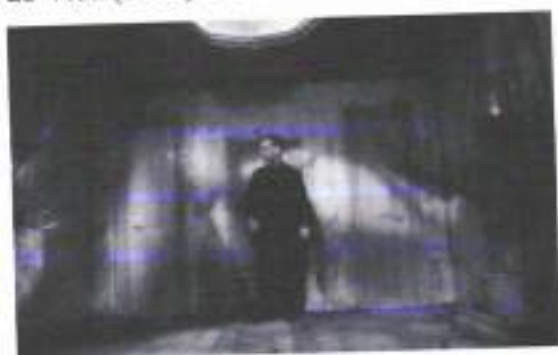
Figura 4: Instituto Benjamenta

Desde a concepção da primeira ideia que tive, já tinha em mente que o filme deveria ser em preto e branco, pois teria um impacto, um atrativo e uma atenção maior na imagem e nas ações dos personagens. Além disso, todas as referências estéticas que colhi ao longo do tempo eram em preto e branco, das fotos dos artistas inspiradores aos filmes que fazem parte da minha estética, como Begotten (1991), Instituto Benjamenta ou Este Sonho que as Pessoas Chamam de Vida (1995) e O Cavalo de Turim (2011).