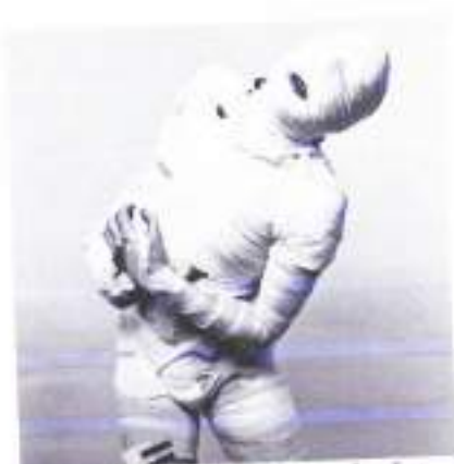
Figura 1: Rudolf Schwarzkogler