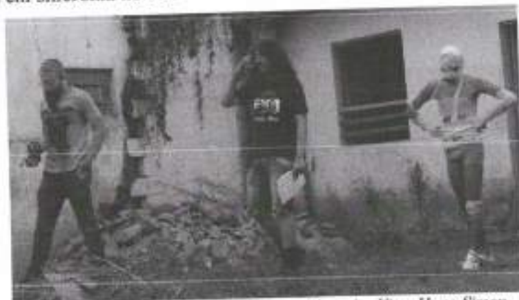
Figura 14: Intervalo entre os planos – A autoria: Vuor Hugo Simon

primeiro resultado da primeira sequência do filme, que precisaria ser forte, e bela imagneticamente. Quando finalizamos o terceiro e melhor take, desse plano sequência, fomos para a próxima sequência do filme, uma cena em que o personagem principal avista uma criatura que o assombra e ele volta assustado para a casa. Seguimos nesse mesmo formato, dando liberdade para o ator, e o seguindo capturando as ações. Nesse plano, também em sequência, tivemos apenas um take, que foi perfeito, e aí finalmente estávamos pegando ritmo e todo mundo estava em sincronia no set.