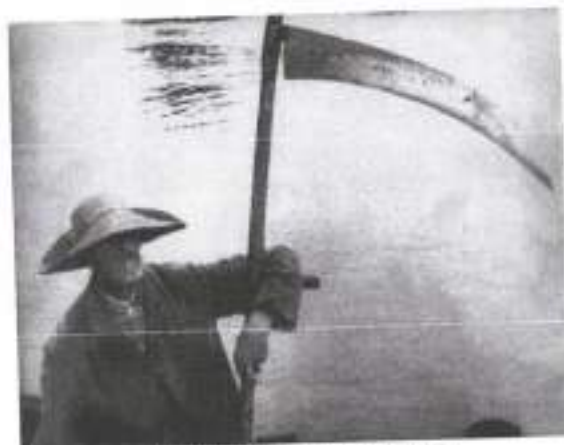
Figura 9: O Vampiro (1932)

Tive essa ideia ao ver o trailer de um filme novo de um diretor contemporâneo que me inspira bastante para fazer filmes, O Farol , de Robert Eggers, pois é construído nesse aspecto quadrado, em 2019, coisa que não é muito comum nos tempos do widescreen e das telas enormes e estreitas, vejo isso como uma homenagem a todos os cineastas do horror e do cinema clássico que vieram antes de nós, e pavimentaram o caminho para que pudéssemos chegar aonde chegamos.