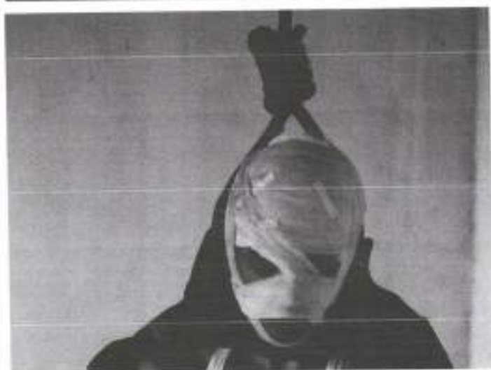
Por Iuri Rocha, L. H. Girarde e Yasmin Rocha