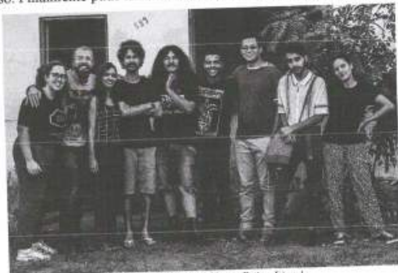
Figura 15: Equipe

em casa, muito cansado, mais até que no primeiro dia, mas muito tranquilo, menos preocupado e menos ansioso. Finalmente pude ter um descanso real em uma semana de preparação.