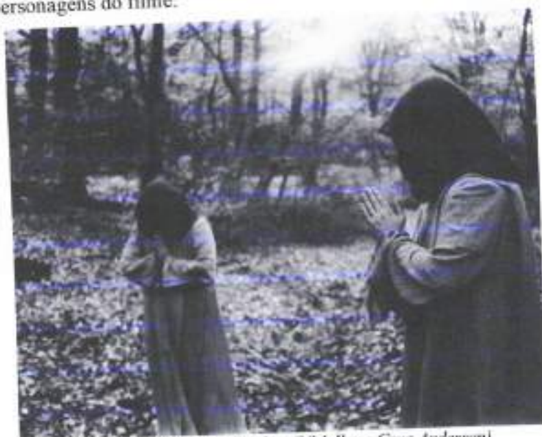
Figura 3: Sunn O))) (Stephen O'Malley e Greg Anderson)

vida, e por ser músico eu sempre me abro a todos os estilos e gêneros musicais possíveis, do mainstream popular ao avant-gard experimental. E nessas minhas horas e horas de pesquisa musical, achei alguns artistas que fazem parte dessa estética do filme, a mais inspiradora com certeza a banda americana Sunn O))), que faz um drone doom metal, um tipo de música muito lenta, grave, pesada e bem atmosférico, que faz parte não só da trilha sonora, quanto inspirou o figurino para dois personagens do filme.