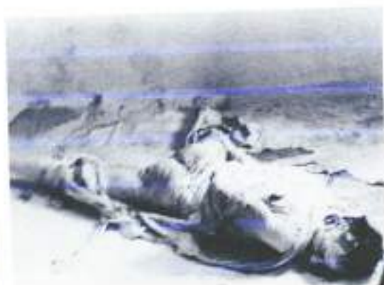
Figura 2: Günter Brus

Já estava decidido a filmar esse primeiro roteiro que eu fiz, já havia em uma possível locação, nos currais na entrada na UESB, mas ainda assim, as ideias que estavam vindo para mim, careciam de um suporte financeiro alto, que estava tornando a realização inviável no momento. Fiz um novo tratamento no roteiro, deixando mais simples possível, tentando usar mais a locação natural, sem quase nenhuma interferência externa, de direção de arte, luz etc. Agora que o roteiro estava mais reduzido e natural, fui tentar ver se conseguiria fazer uma visita na locação e fazer uns testes de planificação, fotografia, e o que poderia usar que já estivesse no ambiente e nisso tive uma resposta indesejada, pois fiquei sabendo que aquele espaço não pertencia à UESB e sim ao CETEP e que eu deveria fazer um ofício para tentar agendar uma visita no local, o que me desanimou, ter que lidar com burocracias e eu queria agilizar mais as coisas. Por sorte, tive amigos que puderam me ajudar e consegui outra locação, e adaptei o roteiro para esse lugar e cheguei na quarta e última alteração nesse projeto, que sobreviveu a muitos empecilhos e imprevistos, e agora já tinha uma vida própria e se desvinculou da ideia original de fazer uma narrativa entre fotos das performances dos acionistas, embora esses ainda exerçam grande influência nas ações do protagonista.