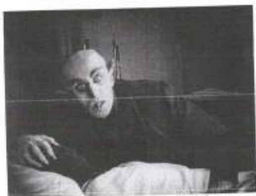
Figura 7: Nosferatu (1922)