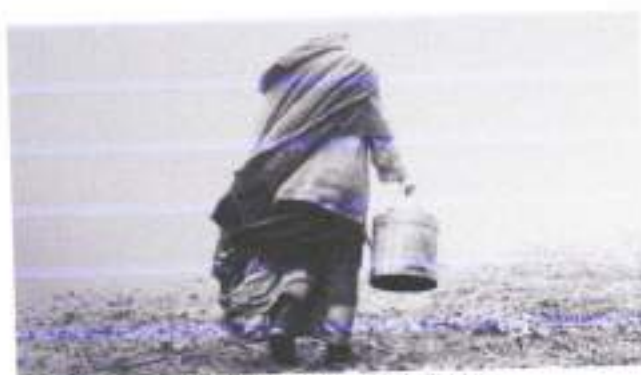
Figura 6: O Cavalo de Turim

Outra coisa importante desse filme, é o aspect ratio em 4:3, pois queria que ele chegasse o mais próximo o possível ao aspecto dos meus filmes de terror favoritos da década de 1920 e 1930, como Nosferatu , O Gabinete do Dr. Caligari , O Vampiro , dando um toque mais sinistro à imagem.