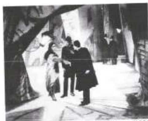
Figura 8: O Gabinete do Dr. Caligari (1920)