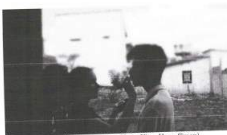
Figura 13: Maquiagem – (Foto: Vitor Hugo Simon)

Assim que a equipe inteira estava no set, alguns atrasados, ainda estávamos dando os ajustes finais no figurino, e veio a minha primeira preocupação em relação a atrasos. Marcamos de começar às 14 horas, e quando fomos terminar o figurino, já tinha passado 45 minutos do tempo proposto. Após terminar, começamos ali a configurar as câmeras o mais próximo possível uma da outra, já em preto e branco, mas no aspect ratio, widescreen 16:9, formato comum do cinema, mas a minha ideia no princípio era já filmar em 4:3 padrão, com a tela quase quadrada, mas por limitações das câmeras não foi possível, então sugeri aos fotógrafos que filmassem o mais centralizado possível, porque na edição iria fazer um crop nas imagens.