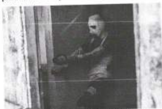
Figura 11: Figurino 1