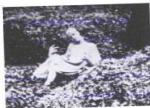
Figura 5: Begotten