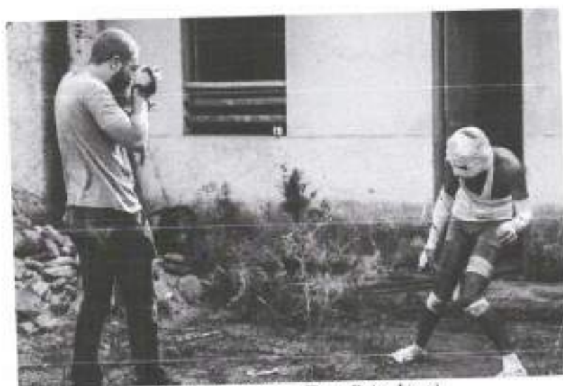
Figura 10: Câmera

pensando diretamente no local, e como houve mudanças, tive que repensar a planificação e decupagem inteira. Minha influência maior para os movimentos de camera foi Gaspar Noé, principalmente o filme Climax (2018), pois a camera anda e se movimenta o tempo inteiro como uma entidade viva na história, seguindo os personagens, os espiando e observando, nos contando a história, e no meu filme segue essa mesma ideia, a câmera seguir os passos do personagem todo o tempo, a partir do momento em que ele acorda e se levanta. O diretor Harmony Korine foi outra influência para mim no que diz respeito a filmar à luz natural, também possui o estilo da câmera na mão, uma experiência voyeurística, característica comum ao estilo do Dogma 95 , então a trouxe para o meu filme.