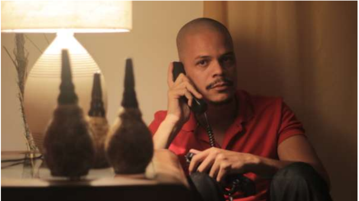
Figura 5 - Fotografia feita com dois Fresnéis e um abajur

Na grande maioria das cenas utilizamos uma lente fixa de 50mm, já que a mesma possui uma abertura maior de 1.8 diferente da 18x135, que também foi utilizada em algumas cenas, mas a abertura máxima dessa é apenas de 3.5mm. O grande problema da lente 50mm seria o foco, então a utilizamos em cenas que foram gravadas com câmera fixa, exceção para a cena em que Flávio caminha pela noite, e temos luzes desfocadas ao fundo, pois apesar da dificuldade de foco com a lente 50mm, conseguimos um bom efeito de desfoque. Essa lente também costuma tremer com qualquer balançar, tornando difícil de ser utilizada na mão, por isso boa parte das cenas feitas com ela foram realizadas com a ajuda de um tripé ou do stedycam .