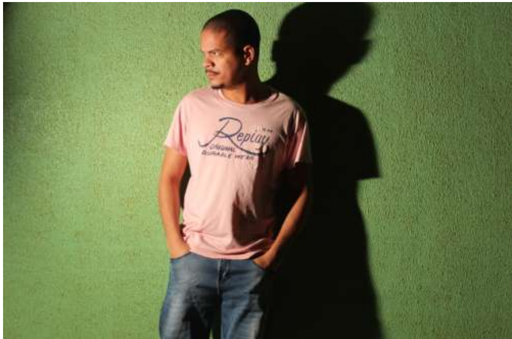
Figura 13 - Um dos Figurinos do personagem usado durante o filme

Constituído essencialmente de um figurino bem básico, que se resumiam a blusas polo, calças jeans, tênis e bota. De modo geral, este estilo passa uma imagem de pessoa tranquila e pacífica.