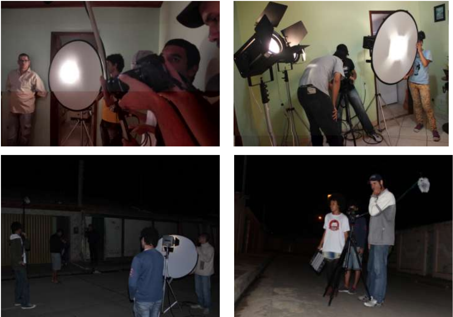
Figura 3 – Parte da equipe técnica, em cenas internas e externas.

Durante a pré-produção, fizemos o cronograma de todas as cenas, para que tivéssemos um controle sobre as gravações do dia. Naturalmente que encontraríamos algumas dificuldades em segui-lo passo a passo, pois imprevistos são inevitáveis, e eles começaram a aparecer logo no primeiro dia de filmagem.