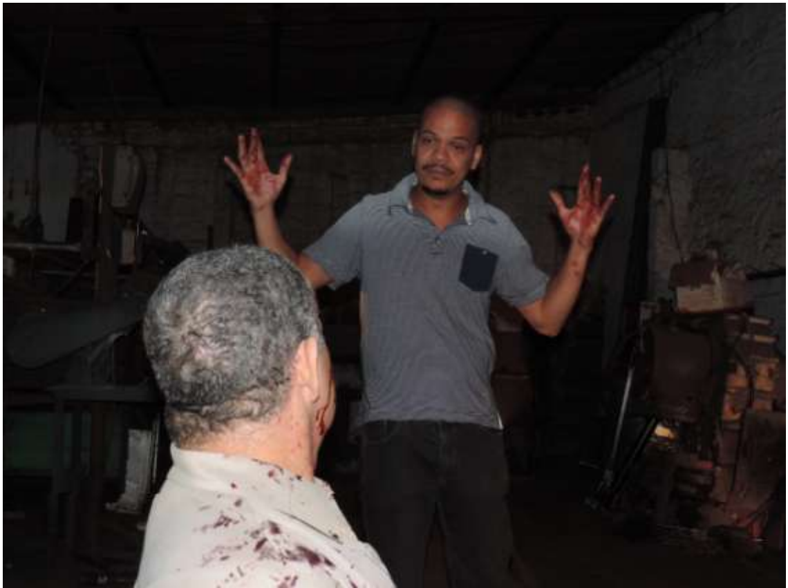
Figura 7 - Cena filmada no galpão.

Às vezes, elevar um pouco o ISO é a única solução, por isso é importante conhecer sua locação com algumas horas de antecedência e, se possível, sempre fazer uma pré-light no dia anterior.