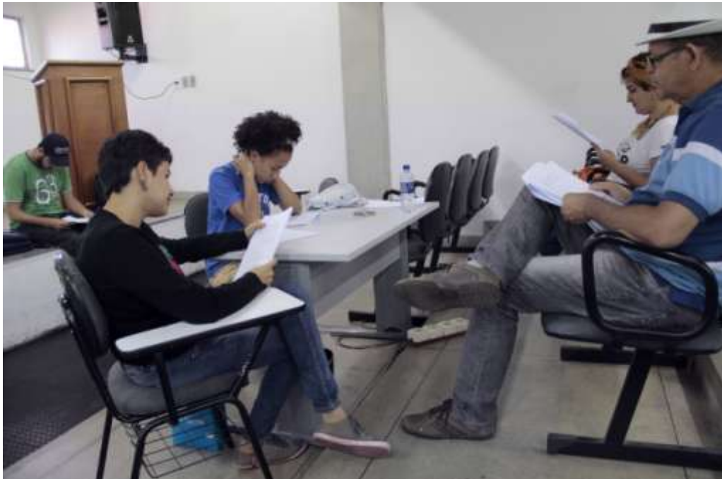
Figura 1 - Leitura e discussão do roteiro