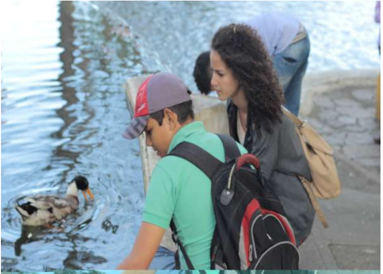
Figura 6 - Cena filmada durante a tarde, utilizando a luz natural do dia.

Nossa maior dificuldade com granulação em cenas se deu nas filmagens que se passam no galpão, pois o local era grande, havia bastante movimentação dos personagens, e as cenas seriam todas feitas à noite. Isso fez com que tivéssemos que elevar o ISO um pouco, usamos até 300, que é uma numeração razoável. Também não podíamos levar muitos equipamentos de luz, já que nosso meio de locomoção era um pouco deficiente para a situação. Mantivemos a luz de dois pontos, e tivemos que compensar com o ISO.