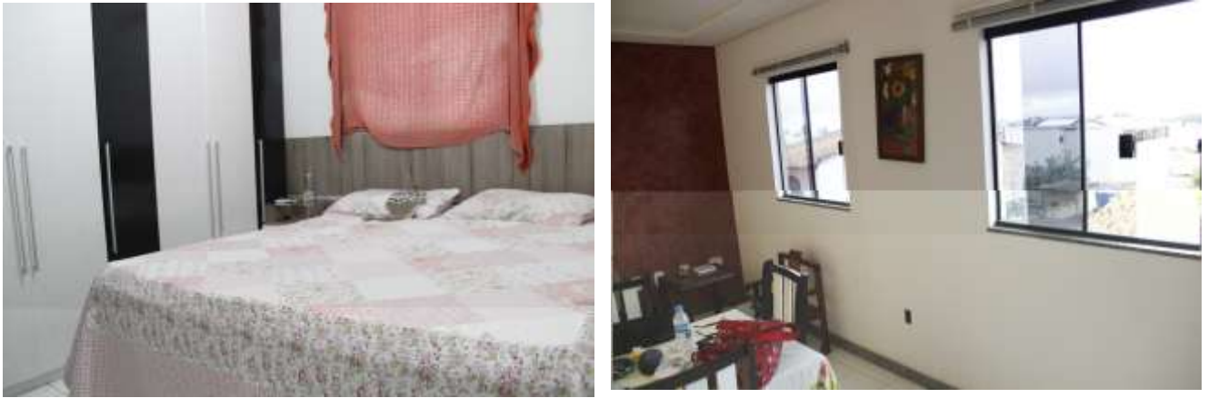
Figura 9 - Sala e quarto da casa de Flávio, antes do tratamento de arte.