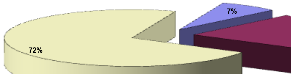
Gráfico 1 - Participação dos Setores no PIB da Ba

Esse “inchaço” neste setor denota que há problemas nessa lógica, pois os serviços que se verificam nos pequenos municípios são de baixo valor agregado e não se vinculam às grandes atividades industriais, como os serviços prestados em áreas de grande movimento econômico.