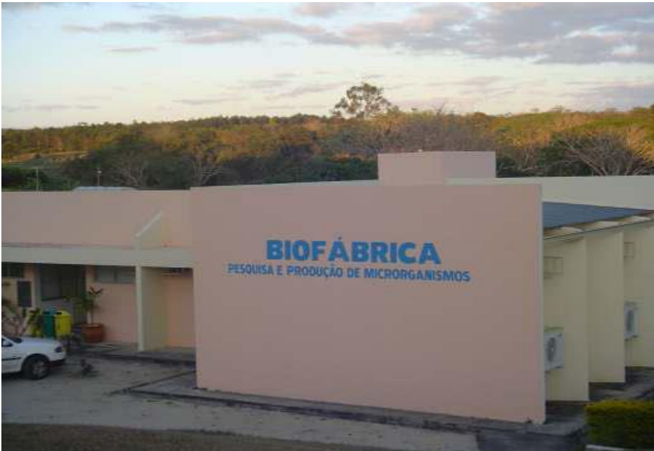
FIGURA 10 - Conclusão da Biofábrica - área construída de 86,97m 2 .