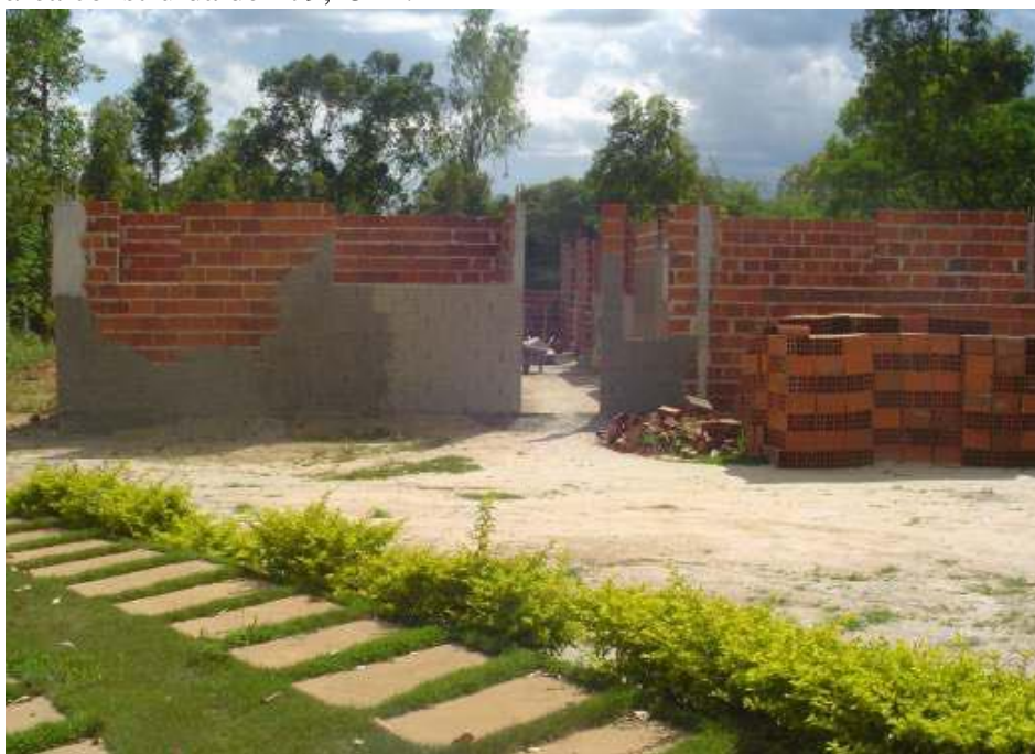
FIGURA 8 - Construção da Segunda Etapa da Residência Universitária, área construída de 279,45m 2 .