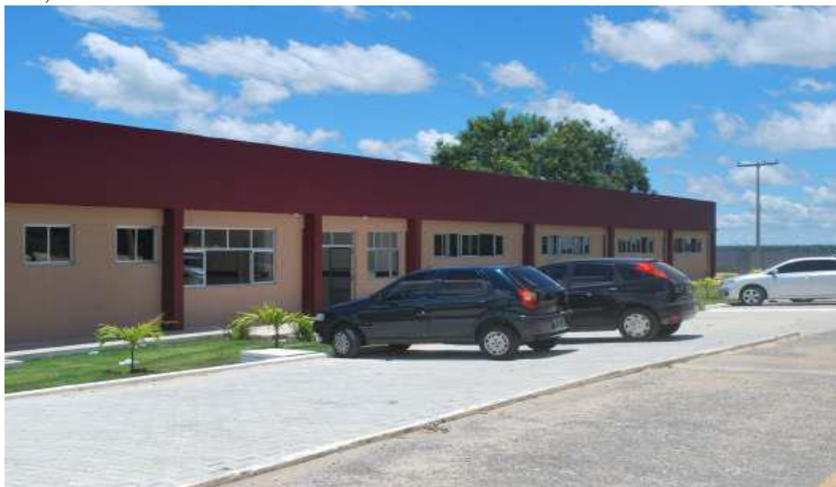
FIGURA 1 - Construção de módulo de salas de aula - área construída de 919,20m 2 .