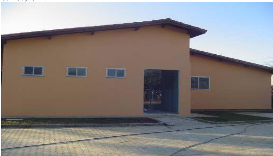
FIGURA 4 - Construção da Fábrica de Doces e Biscoitos - área construída de 407,20m 2 .