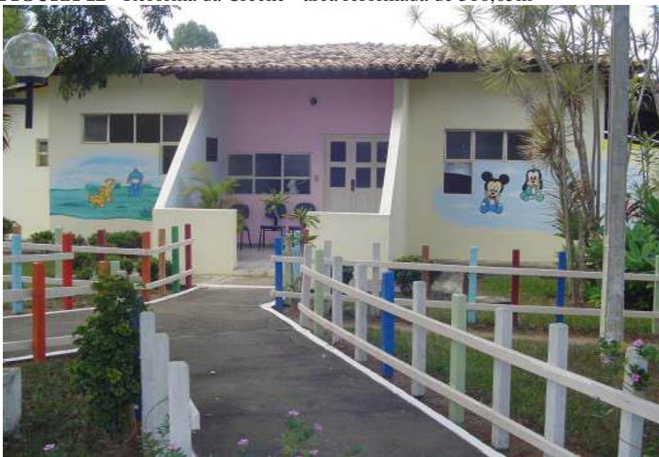
FIGURA 12 - Reforma da Creche - área reformada de 316,65m 2