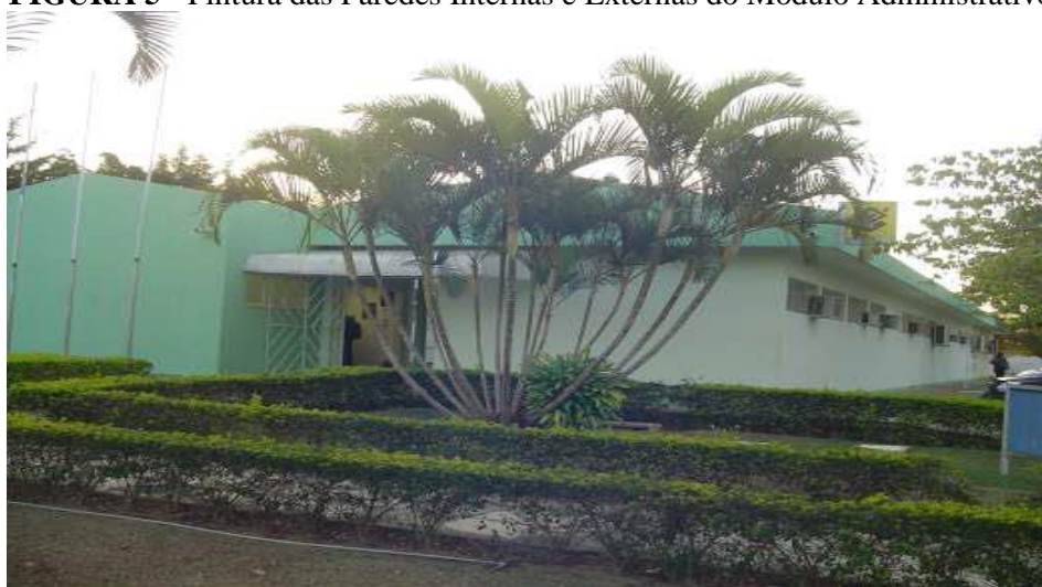
FIGURA 5 - Pintura das Paredes Internas e Externas do Módulo Administrativo.