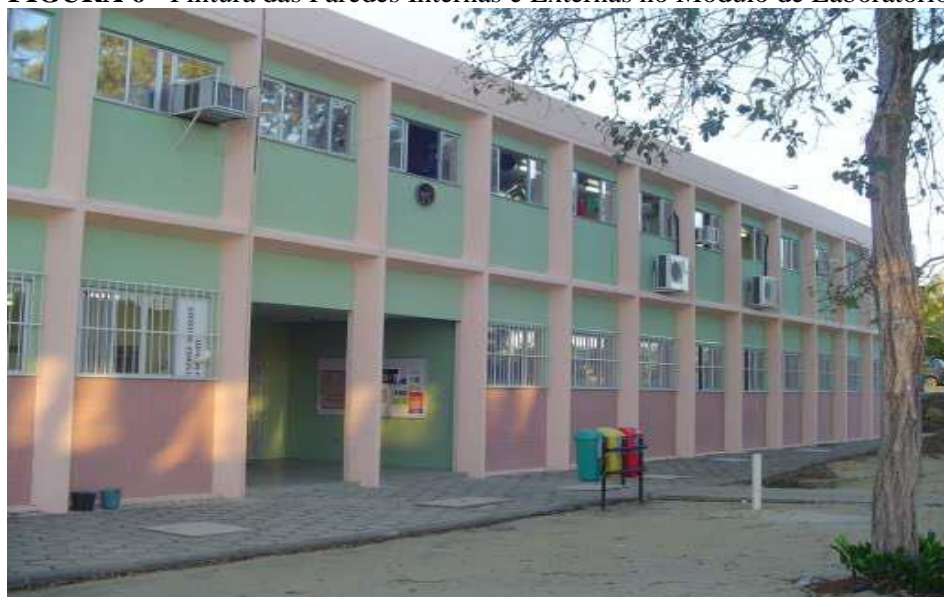
FIGURA 6 - Pintura das Paredes Internas e Externas no Módulo de Laboratórios.