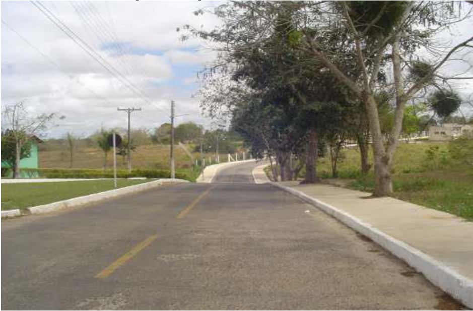
FIGURA 9 - Construção de Calçadas.