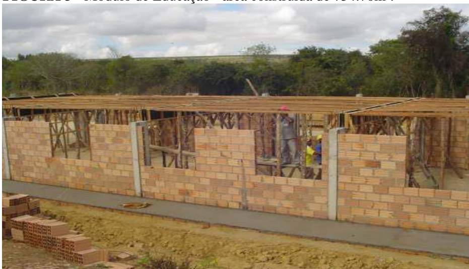
FIGURA 3 - Módulo de Educação - área construída de 754.70m 2 .