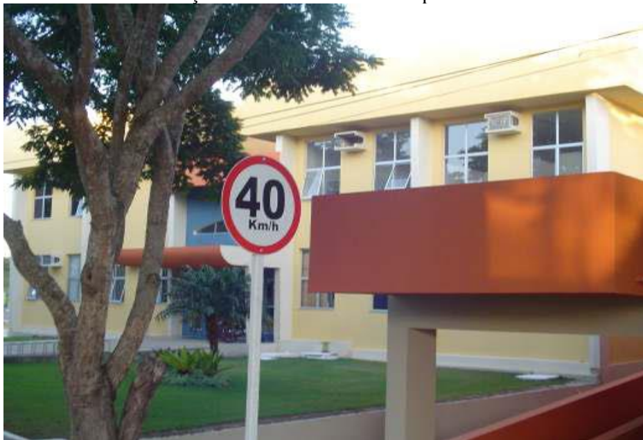
FIGURA 11 - Sinalização das vias internas do campus.