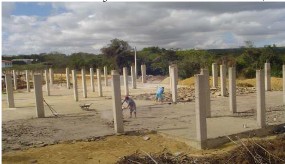
FIGURA 2 - Módulo de Engenharia Florestal - área construída de 1.444,42m 2 .