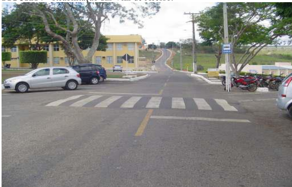
FIGURA 7 - Reabilitação das Vias de Acesso.