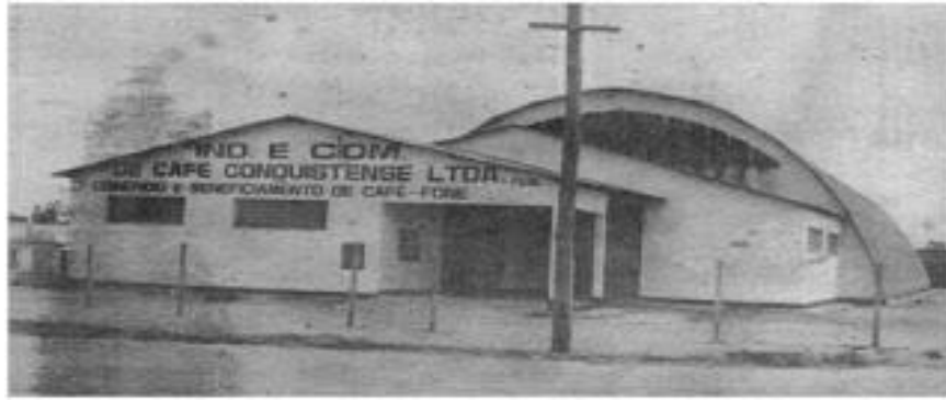
O depósito do "Café Baía" ficava no bairro Departamento