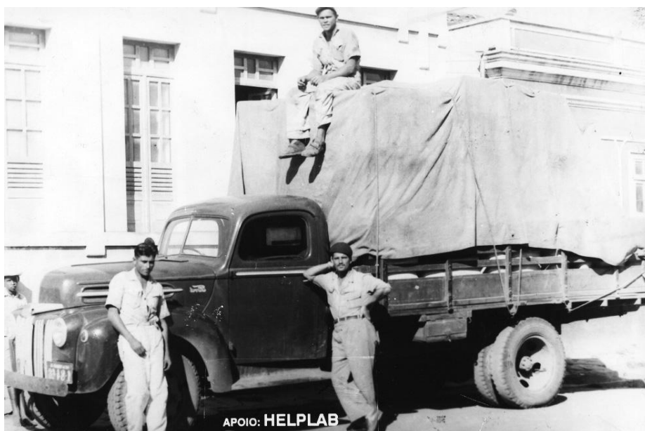
Veículo utilizado para transporte de artefatos de couro

Os Governos Federais do período de 64 a 74 criaram programas para o desenvolvimento do Nordeste. E onde Vitória da Conquista se situava nestes projetos? Basta dizer que o Município está incluindo no chamado Polígono das Secas no Programa da SUDENE. Entretanto, nem mesmo pela opção capitalista, o setor industrial, em Conquista, se estruturou. O fracasso se deve a vários motivos, com destaque para a mentalidade empresarial do conquistense.