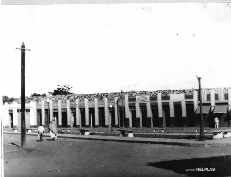
Algumas indústrias surgiram na Pça. da Piedade, hoje Nove de Novembro