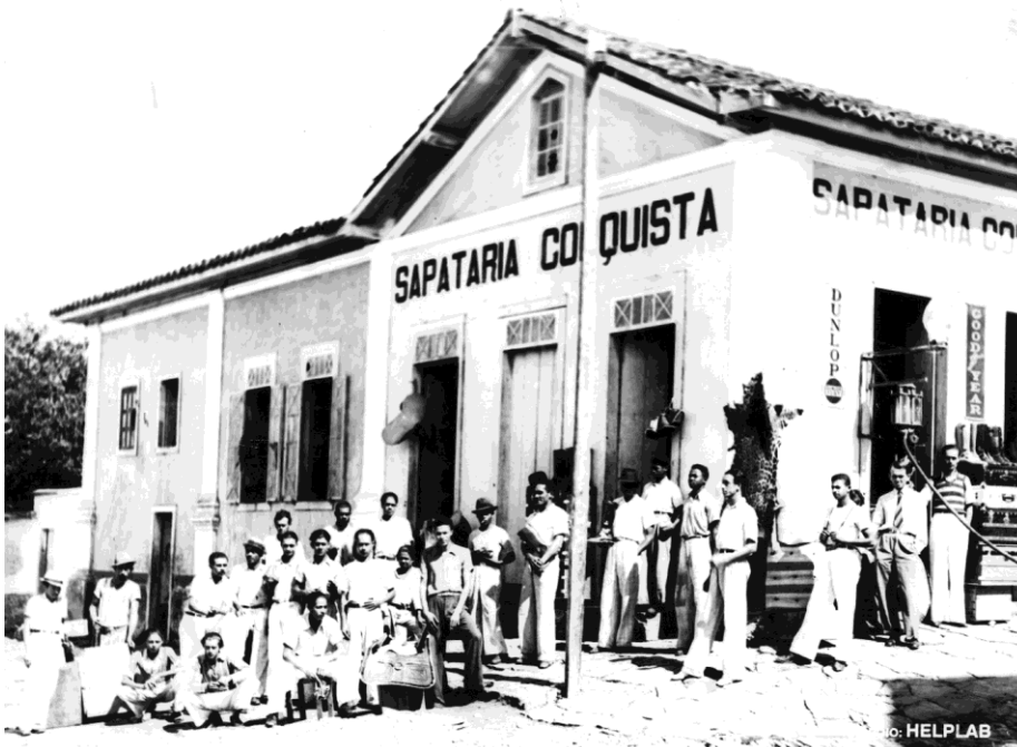
Conquista exportava sapatos para toda a região

A primeira indústria de Vitória da Conquista surgiu quando esta ainda era Arraial da Conquista. Foi uma Cerâmica, no lugar conhecido como Batalha, onde os oleiros fabricavam telhas, tijolos etc. A única indústria que progrediu nas primeiras décadas deste século, no entanto, foi a de fabricação de calçados, selas e outras artefatos de couro, que eram produzidos em quantidade para exportação.