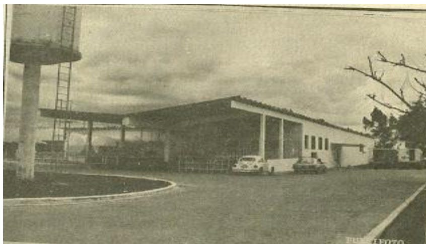
Modernas instalações da Lavisa em 1978