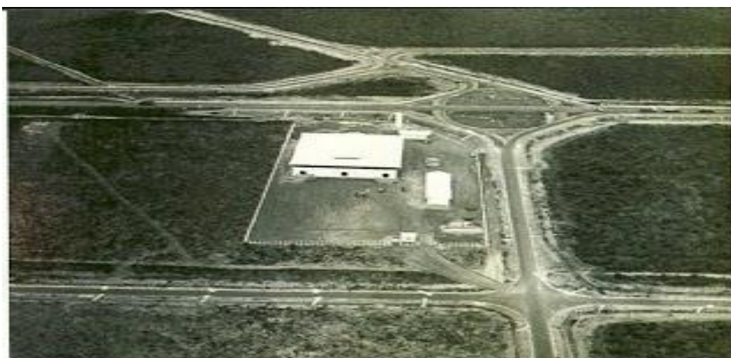
Foto 1 - Imagem aérea do DII em 1975.

Fonte: http://tabernadahistoriavc.blogspot.com.br/