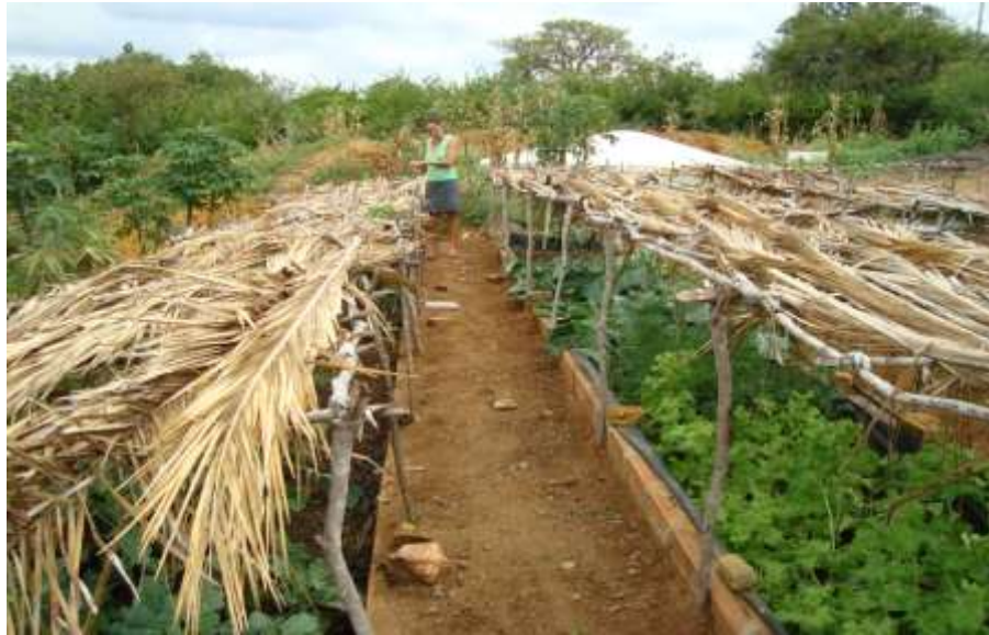
Figura 21 - Canteiro Econômico