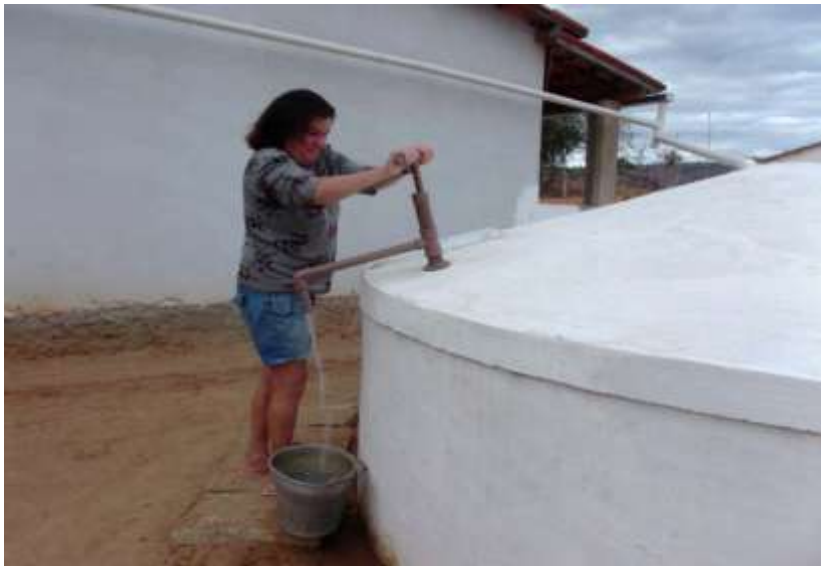
Figura 3 - Utilização da bomba manual para retirada de água da cisterna

de fácil construção e de baixo custo. Sua utilização tem como objetivo evitar que as famílias utilizem utensílios como baldes para fazer a retirada da água da cisterna, o que poderia contaminar a água, deixando-a imprópria para o consumo humano.