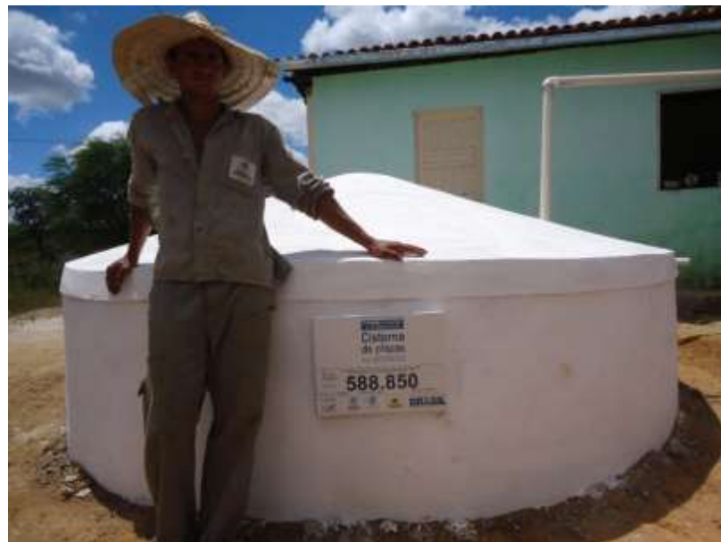
Figura 2 - Cisterna de placas de 16 mil litros do P1MC