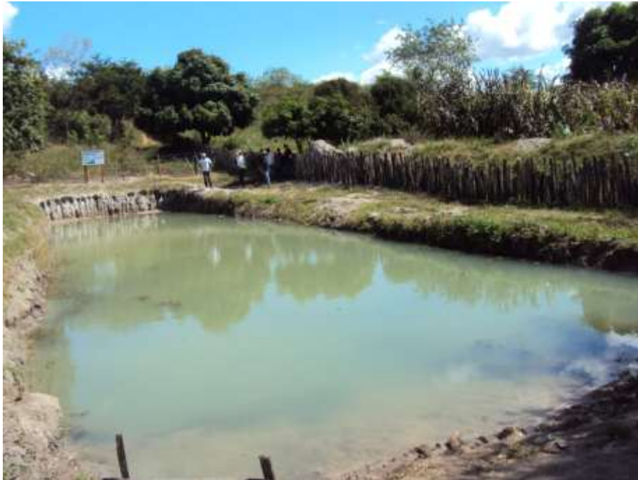
Figura 7 - Barreiro trincheira