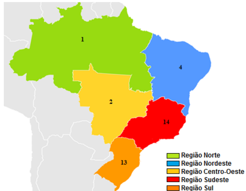
Figura 1 (distribuição da produção acadêmica nas regiões do Brasil)