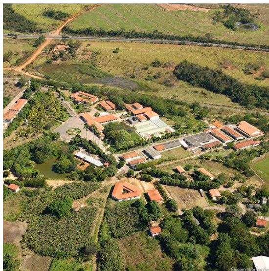
Figura 9 – Fotografia aérea do IFNMG – Campus Salinas