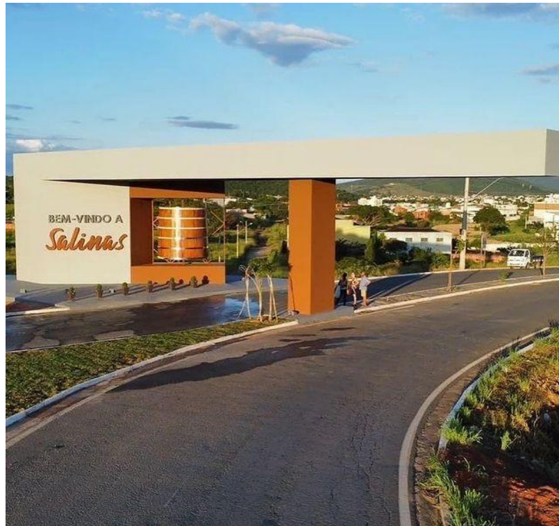
Figura 2 – Entrada da cidade de Salinas – MG