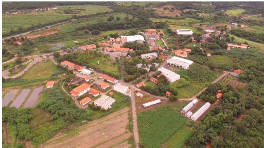
Figura 7 – IFNMG/Campus Salinas

Os terrenos pertencentes ao estabelecimento, localizados na área conhecida como Fazenda Varginha, situada no quilômetro dois da Rodovia Salinas/Taiobeiras, foram generosamente cedidos ao Governo Federal. Esta doação representa um gesto de colaboração e parceria, contribuindo para o desenvolvimento de projetos e iniciativas de interesse público. A transferência dessas propriedades não apenas fortalece a relação entre o setor privado e o governo, mas também possibilita a realização de melhorias e investimentos na região, beneficiando a comunidade local.