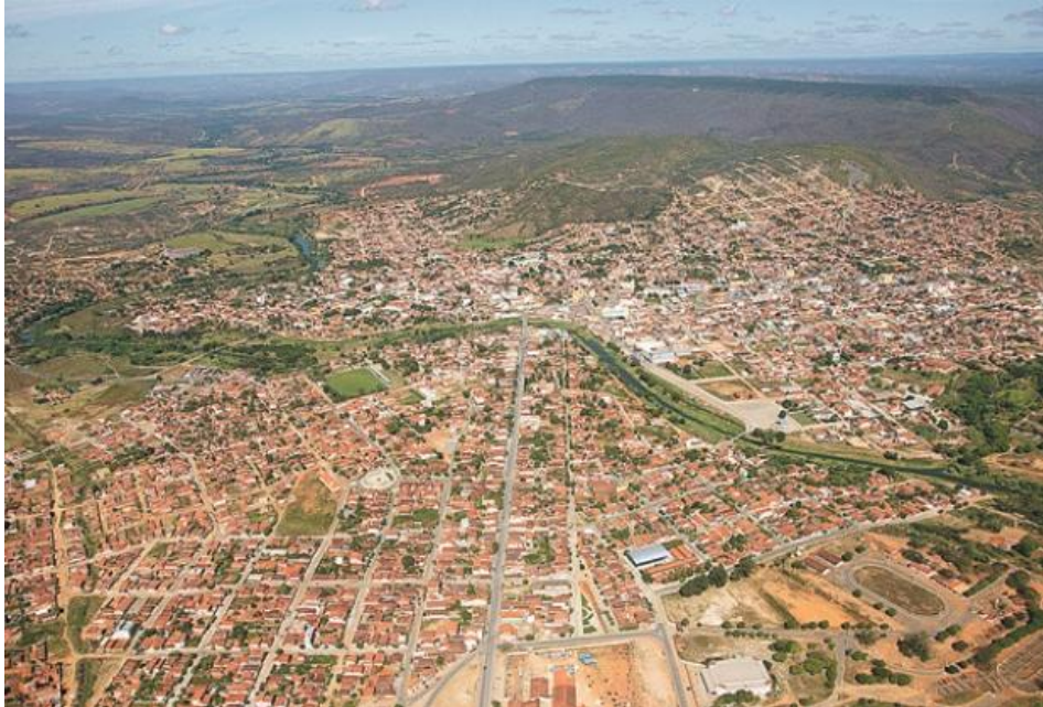
Figura 1 – Fotografia aérea da cidade de Salinas – MG