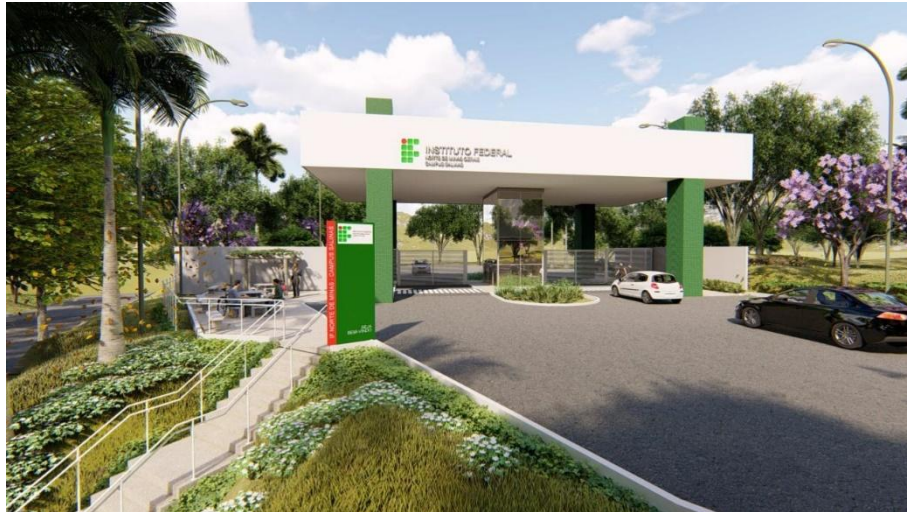
Figura 8 – Entrada do IFNMG/Campus Salinas

extensão, com a intenção de “formar cidadãos habilitados, qualificados profissionalmente, com valorização humana, atuantes no desenvolvimento da sociedade e, dessa forma, contribuir para a melhoria da qualidade de vida da comunidade regional a que se integra” (IFNMG, 2020).