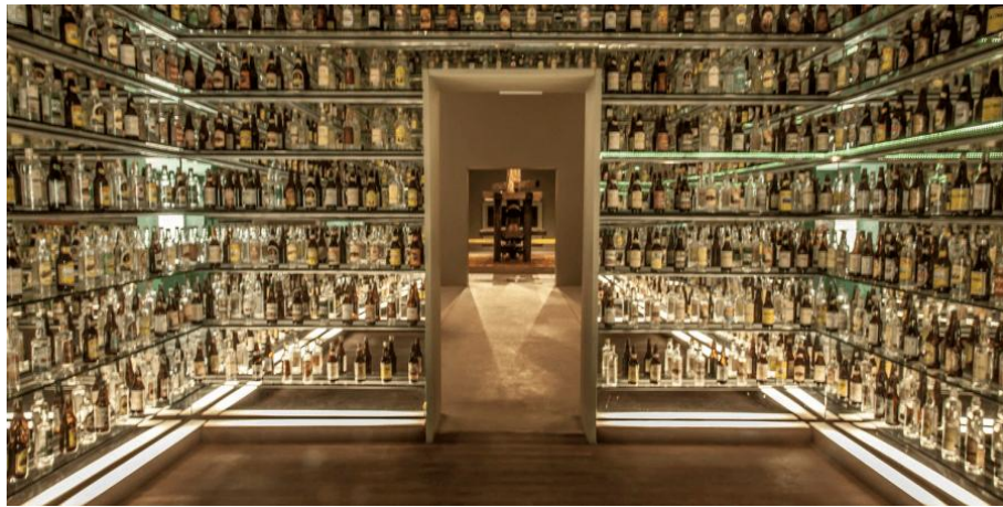
Figura 4 – Sala de exposição de cachaça do Museu