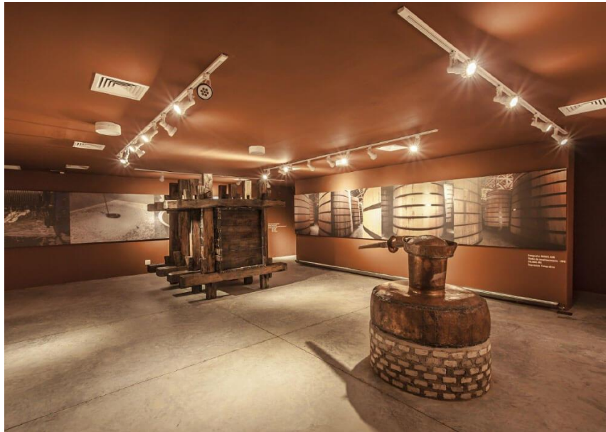
Figura 3 – Sala de exposição de artefatos do Museu da Cachaça

Fonte: Figura retirada do site da Cachaça Seleta. Sala do Museu da Cachaça, 2024.