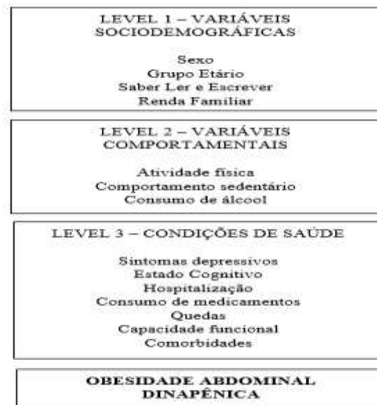
Figura 2. Modelo conceitual de determinação do resultado usado na análise múltipla. Lafaiete Coutinho, Brasil, 2014.