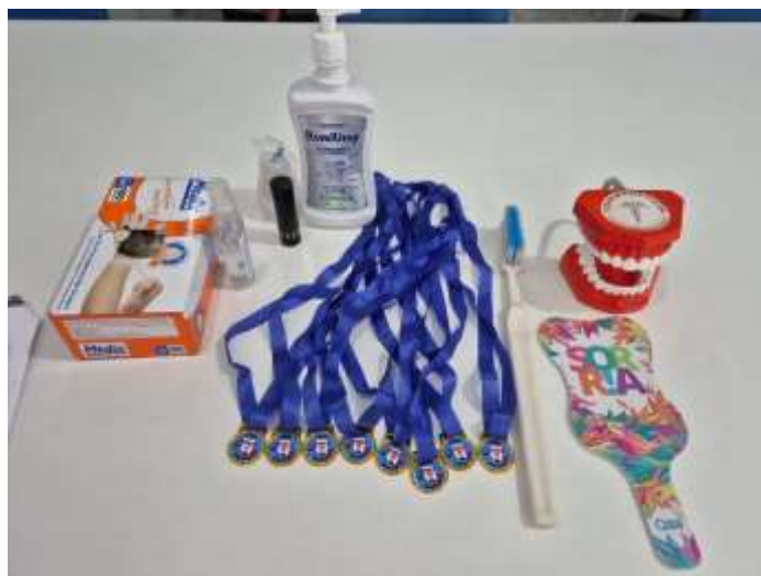
Figura 1 – Materiais odontológicos utilizados no estudo principal na intervenção com as crianças com TEA participantes do estudo no município de Jequié-BA, 2025.

Legenda: Materiais utilizados foram: evidenciador de placa líquido (Ilumilimp®), lanterna UV, manequim macromodelo odontológico, copinho plástico, espelho no formatado de dente, luva de procedimento, medalhas de premiação como reforço positivo.