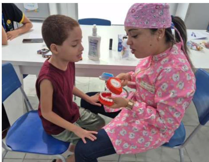
Figura 4 – Intervenção educativa sob o método convencional de educação em saúde bucal com o auxílio de manequim macromodelos odontológicos com as crianças com TEA participantes do estudo no município de Jequié-BA, 2025.

Legenda: Demonstração correta da escovação, assim como a limpeza da língua e o uso do fio dental