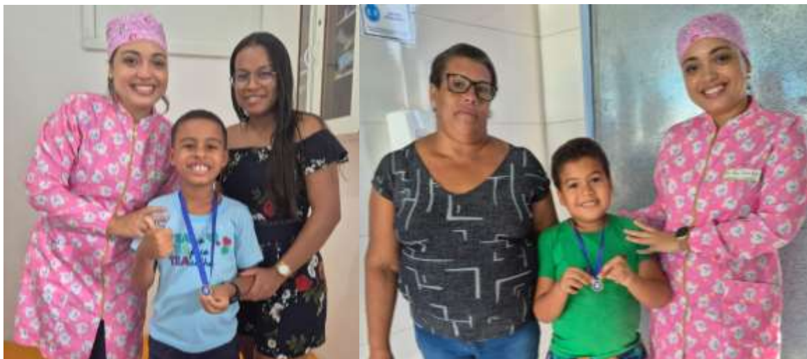
Figura 5 – Entrega da medalha como premiação após finalização da segunda etapa da intervenção com as crianças com TEA participantes do estudo no município de Jequié-BA, 2025.

Legenda: Utilização do manejo odontológico com o reforço positivo para as crianças que concluíram a primeira e segunda etapa da intervenção.