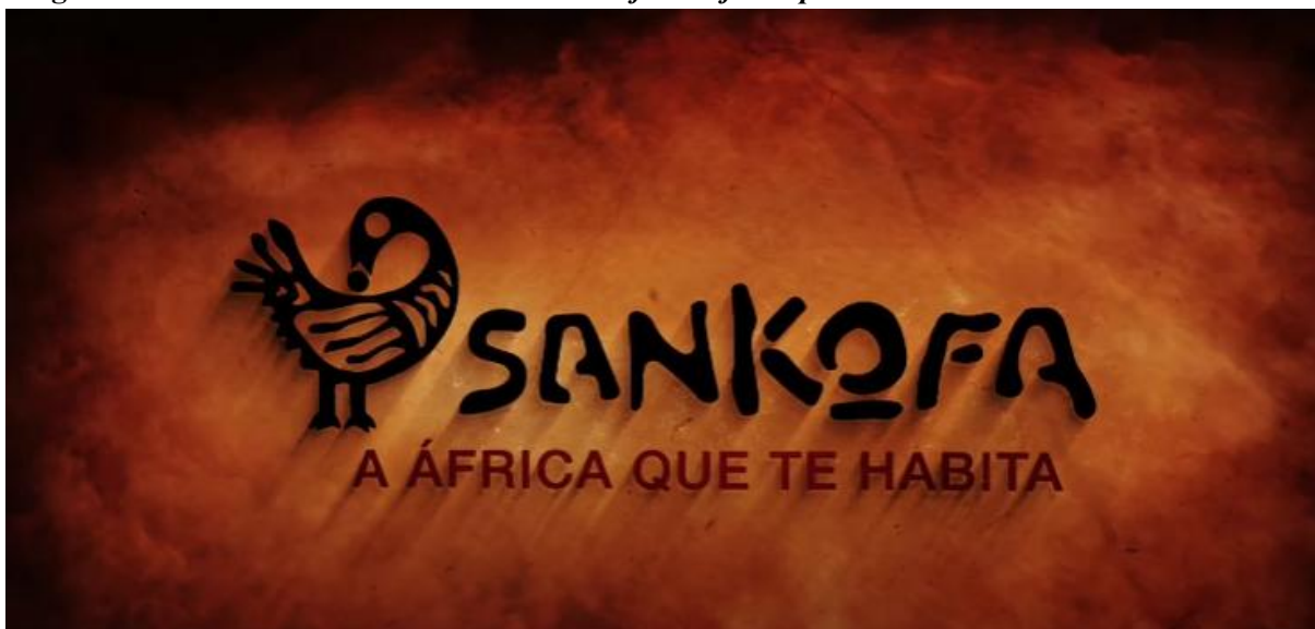
Figura 1 - Frame da abertura da série Sankofa: a África que te habita