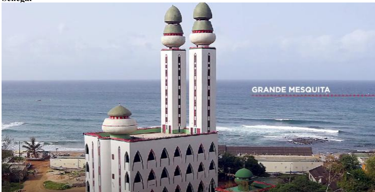
Figura 3 - Frame da série Sankofa: a África que te habita - imagem da Grande Mesquita no Senegal