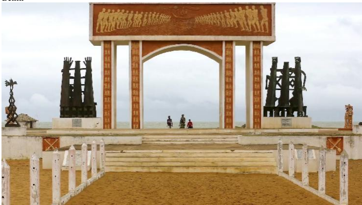
Figura 7 - Frame da série Sankofa: a África que te habita - imagem da porta do não retorno em Benin

Fonte: Sankofa: a África que te habita (2020), episódio 7: Benin. Fotografia de César Fraga (2014).