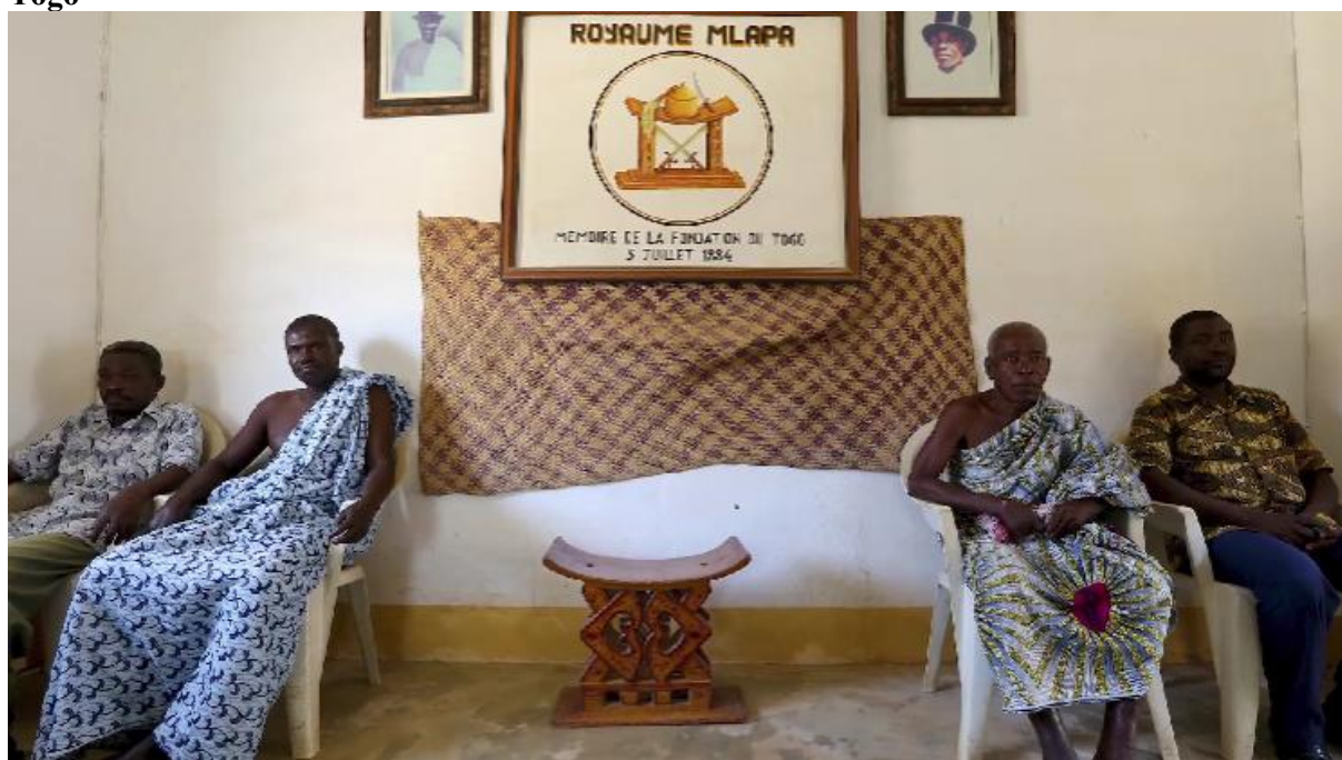
Figura 6 - Frame da série Sankofa: a África que te habita - imagem do interior da casa real no Togo