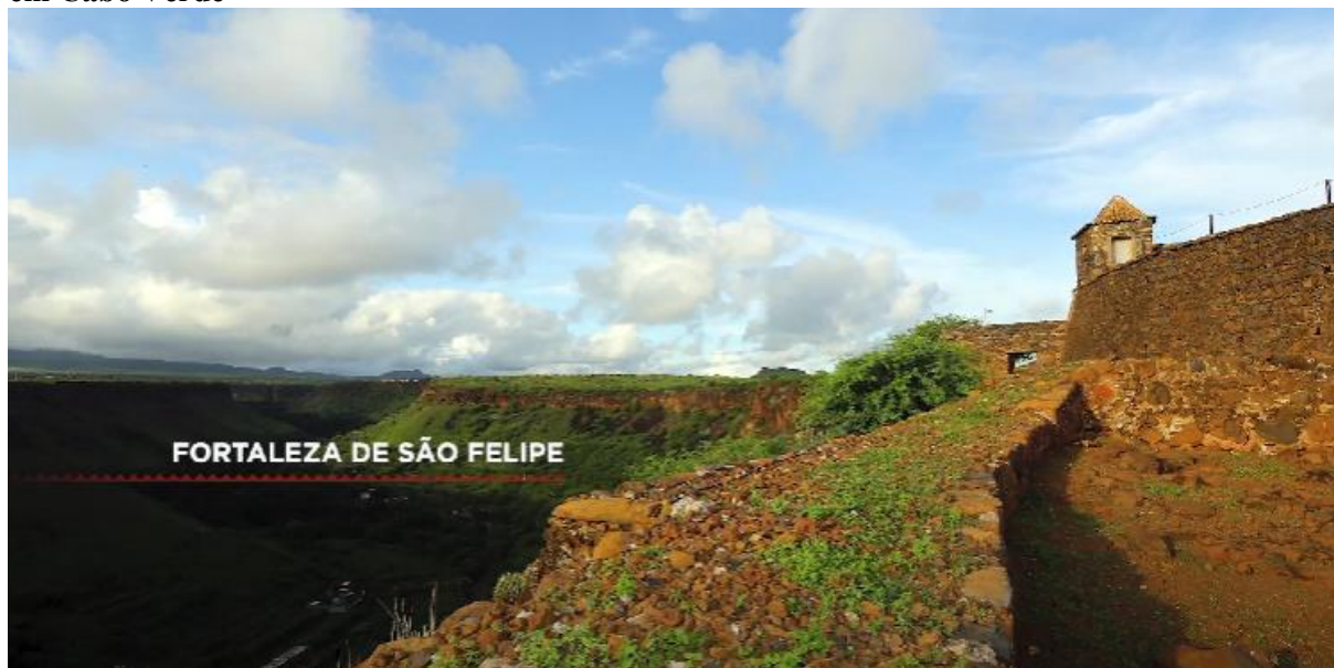
Figura 2 - Frame da série Sankofa: a África que te habita - imagem da Fortaleza de São Felipe em Cabo Verde

Fonte: Sankofa: a África que te habita (2020), episódio 2: Cabo Verde. Fotografia de César Fraga (2014).