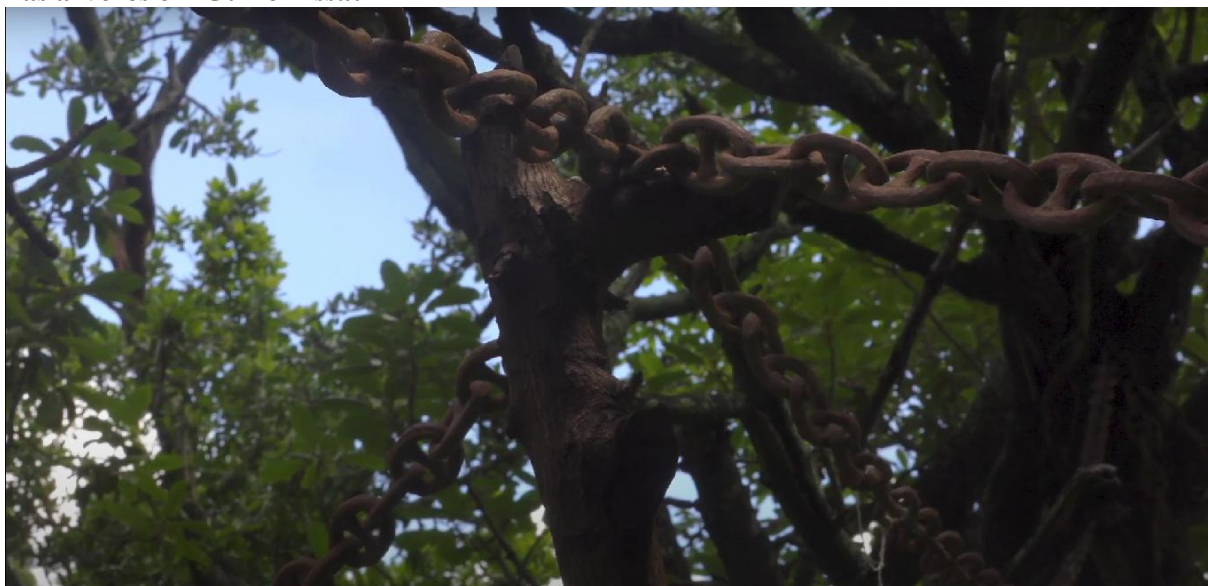
Figura 14 - Frame da série Sankofa: a África que te habita - imagem das correntes penduradas nas árvores em Guiné Bissau