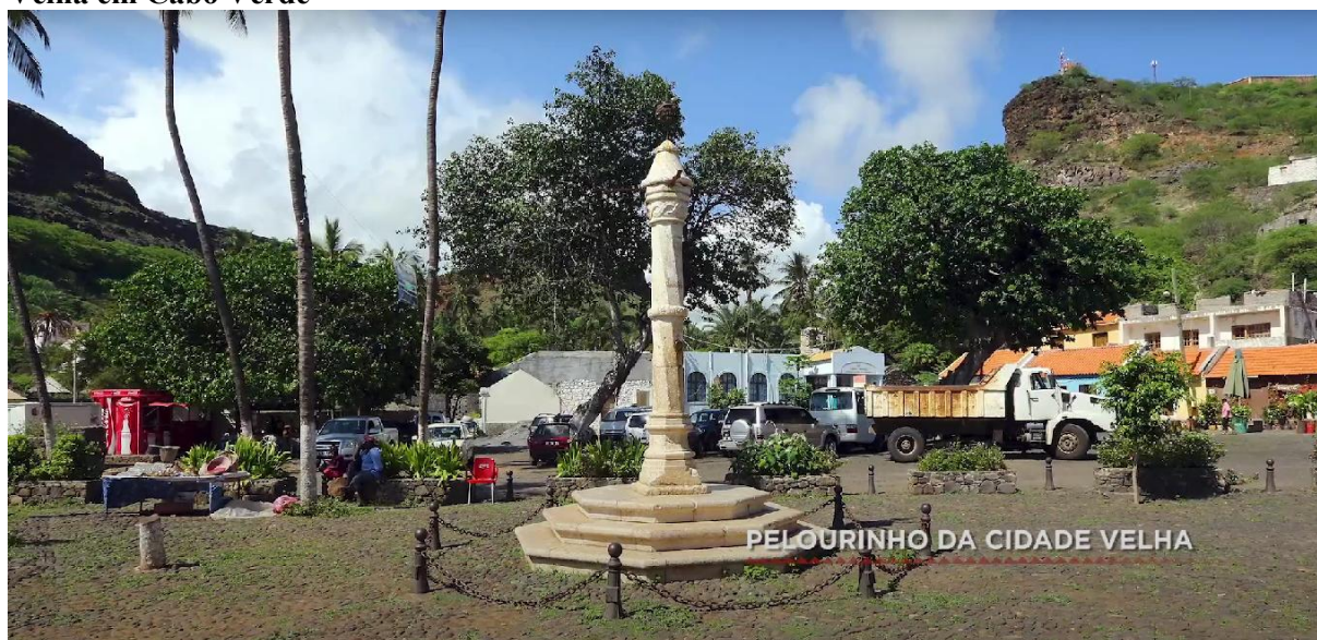
Figura 11 - Frame da série Sankofa: a África que te habita - imagem do Pelourinho da Cidade Velha em Cabo Verde

Fonte: Sankofa: a África que te habita (2020), episódio 2: Cabo Verde. Fotografia de César Fraga (2014).