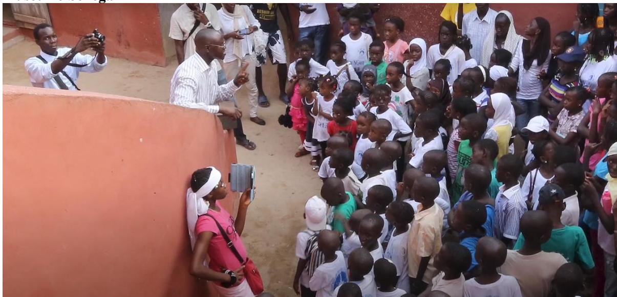
Figura 12 - Frame da série Sankofa: a África que te habita - imagem da Casa dos Escravos, um museu no Senegal