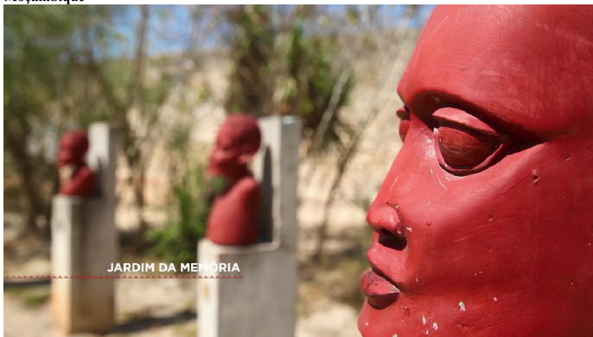
Figura 10 - Frame da série Sankofa: a África que te habita - imagem do Jardim da Memória em Moçambique