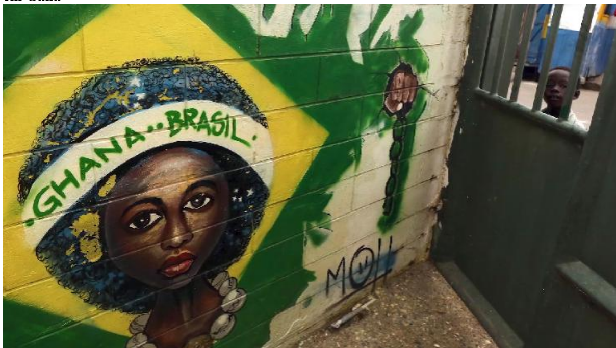
Figura 5 - Frame da série Sankofa: a África que te habita - imagem do mural da Casa do Brasil em Gana