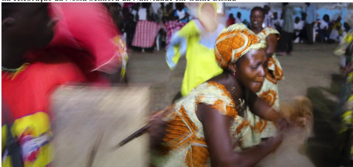
Figura 13 - Frame da série Sankofa: a África que te habita - Imagem de uma mulher dançando na celebração da Nossa Senhora da Natividade em Guiné Bissau