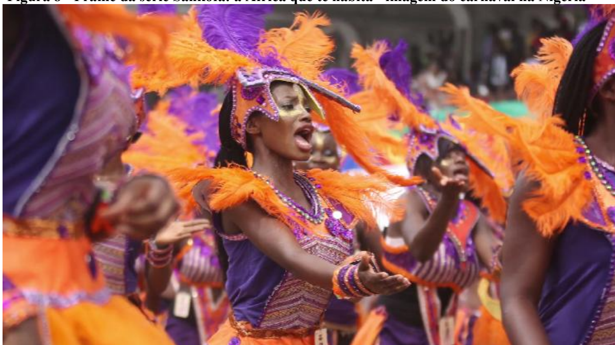
Figura 8 - Frame da série Sankofa: a África que te habita - imagem do carnaval na Nigéria