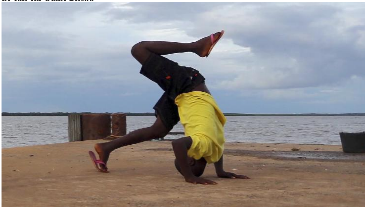
Figura 4 - Frame da série Sankofa: a África que te habita - imagem de uma criança brincando no cais em Guiné Bissau