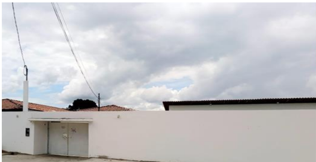
Figura 2 - Unidade de Acolhimento Malvina Costa