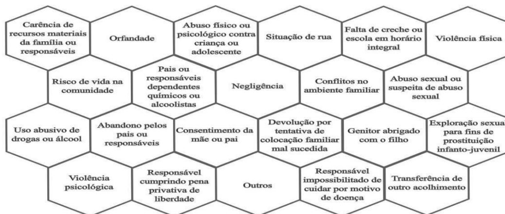
Figura 1 - Motivações destacadas como ensejadoras do Acolhimento de acordo com o Sistema Nacional de Adoção