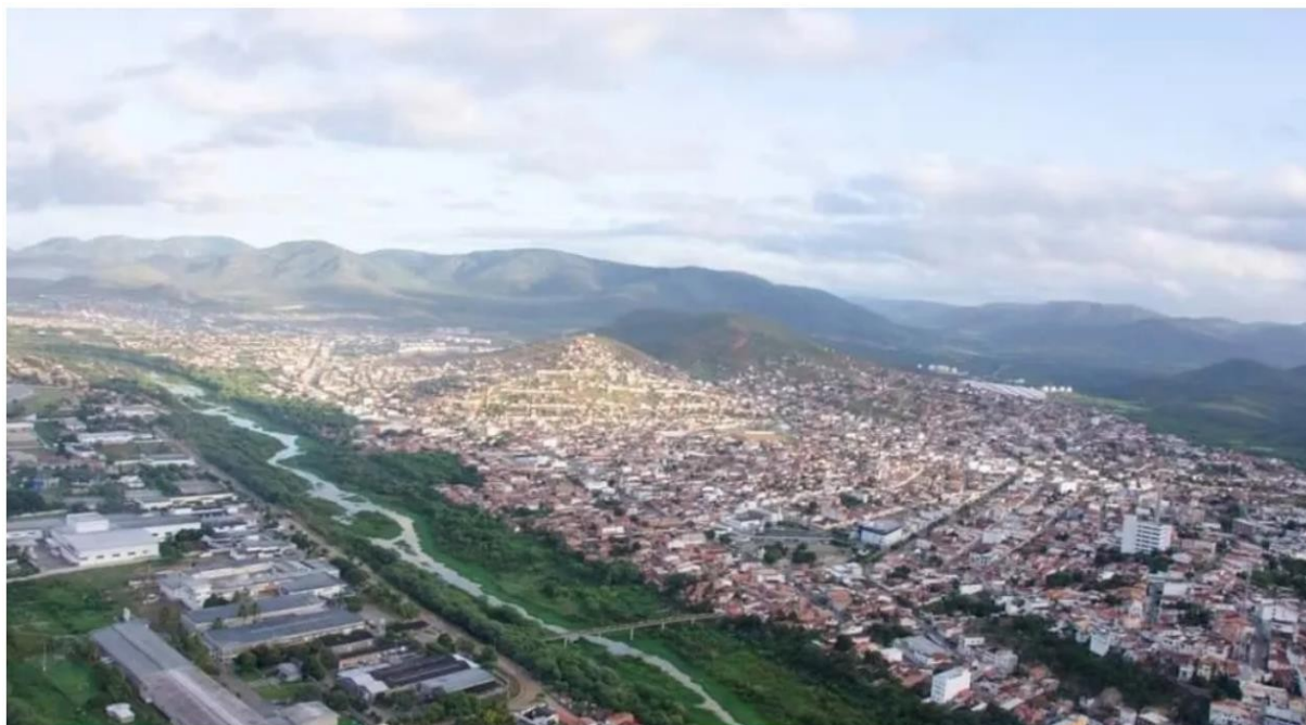
Figura 3: Foto panorâmica da cidade, cortada pelo Rio de Contas.