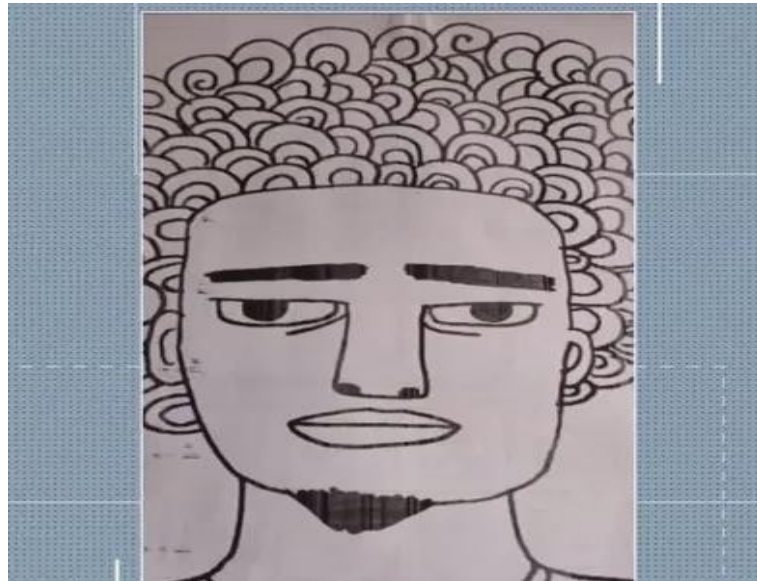
Figura 1: atividade desenvolvida por uma professora no dia da consciência negra, 2021 – (MG)