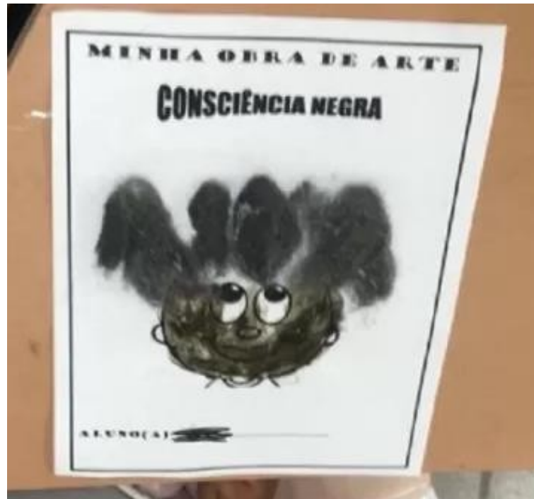
Figura 2: atividade desenvolvida por uma professora no dia da consciência negra, 2023 - (PE)