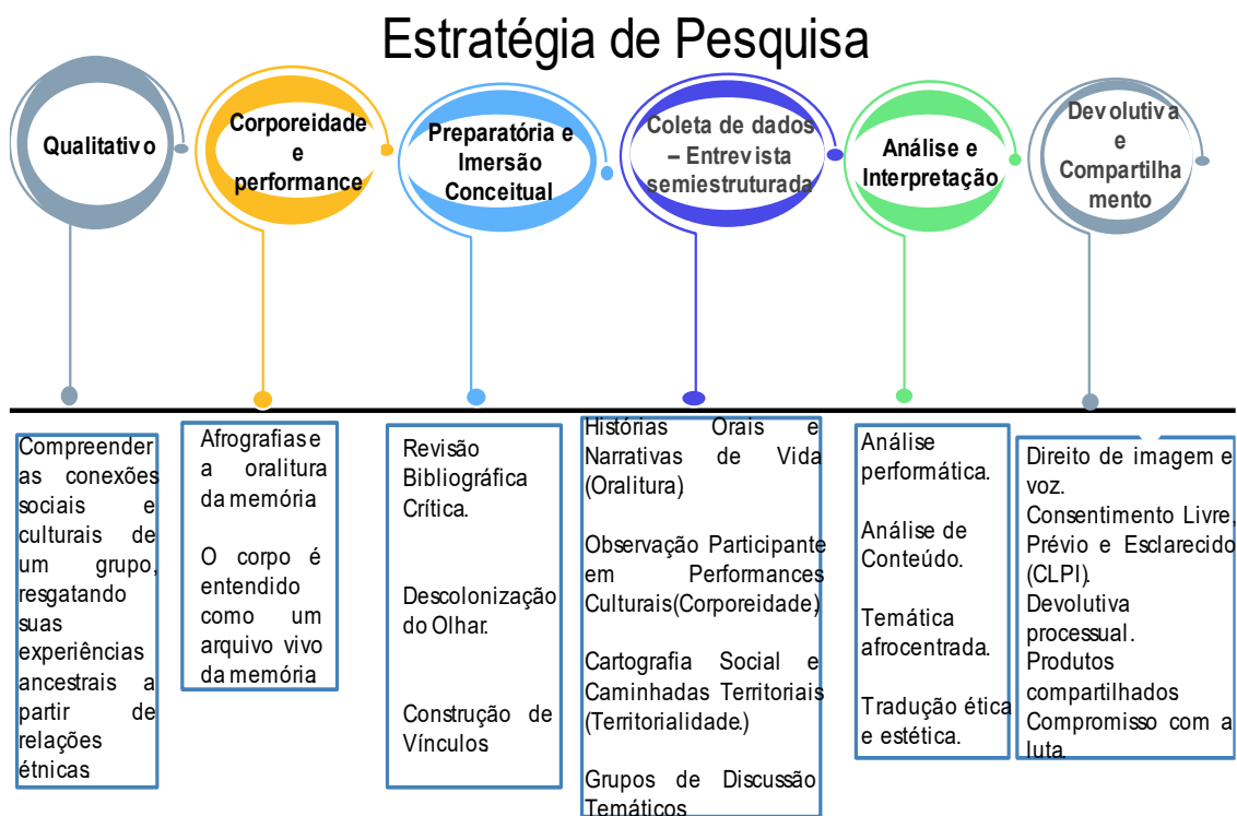
Tabela 1: Estrutura metodológica sintetizada

Essa abordagem será amparada na entrevista semiestruturada, permitindo a captação de experiências subjetivas e a valorização das vozes dos colaboradores estudados. Na primeira inserção no campo, adotei a observação participante, conforme proposto por (Bosi, 2012), em um período máximo de seis meses, buscando estabelecer uma relação dialógica com a comunidade.