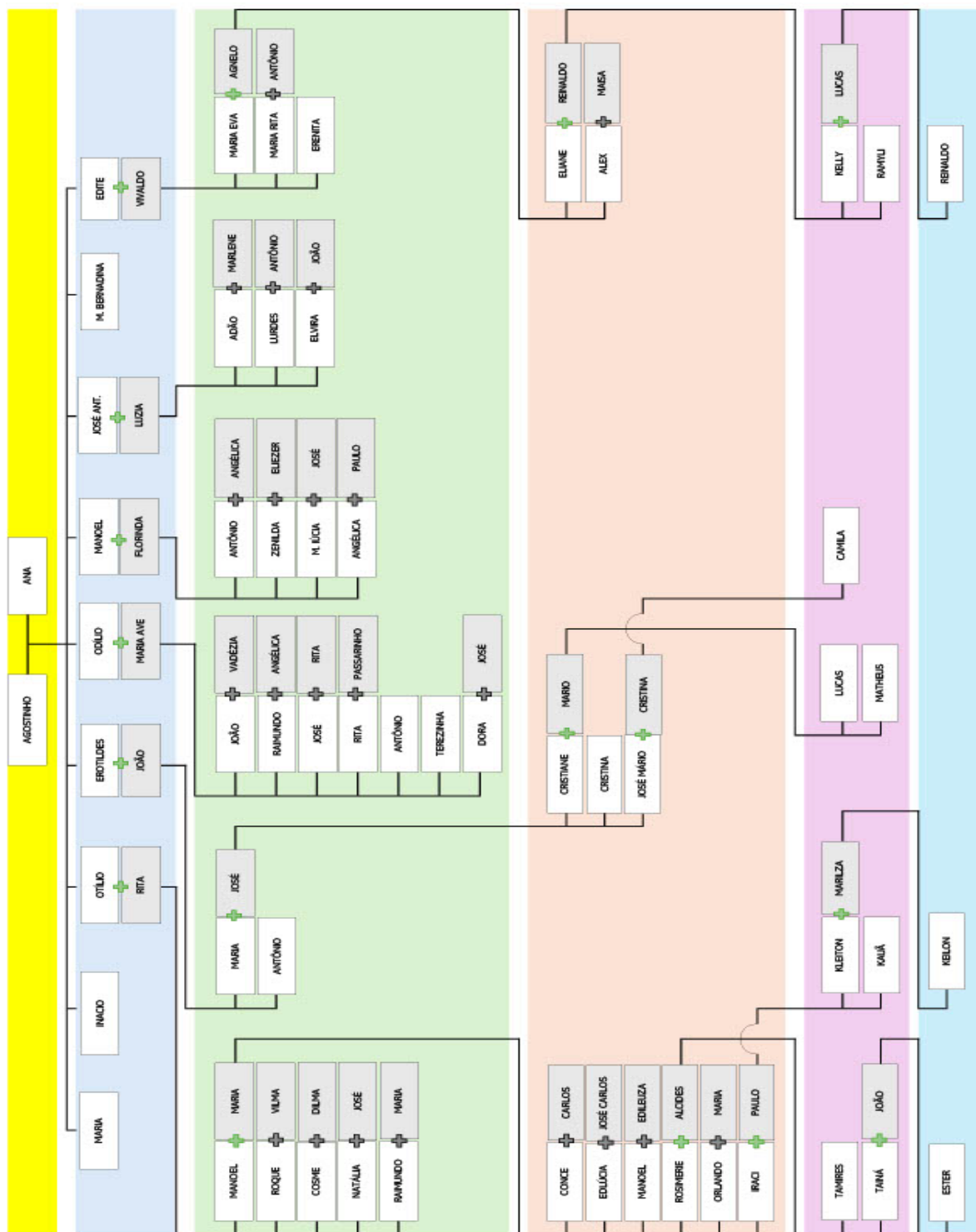
Gráfico 2: Árvore genealógica da comunidade Fazenda Estiva

Fonte: Árvore genealógica produzida pela Profa. Dra. Ana Angélica Leal Barbosa (2026).