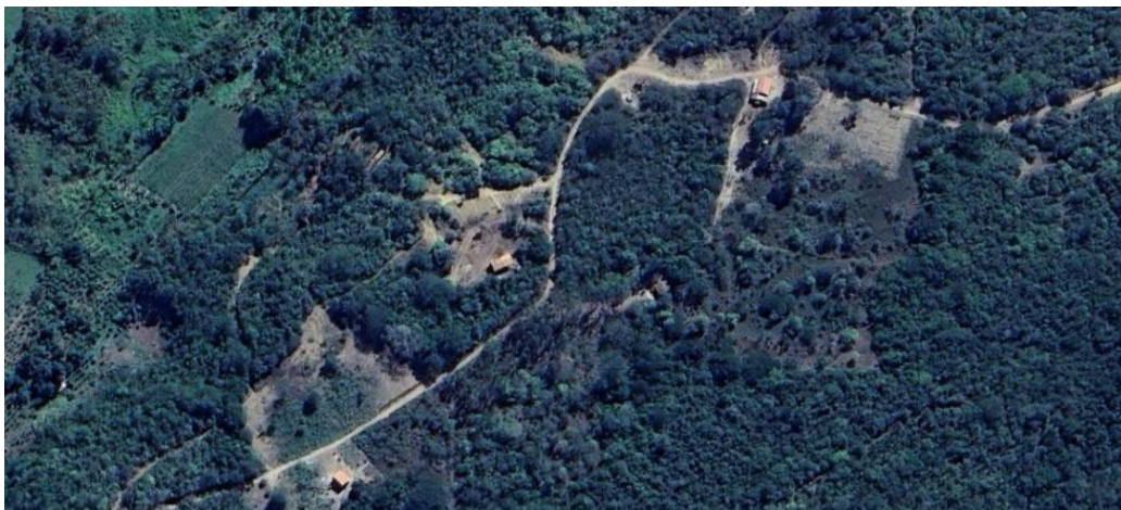
Figura 1: Imagem de satélite da Comunidade Fazenda Estiva

Atualmente, os territórios adjacentes à comunidade vêm passando por significativas transformações socioespaciais, como destacado na figura 1. A partir de 2020, durante a pandemia de COVID-19, observou-se um aumento expressivo na demanda por áreas rurais, impulsionado pela busca de espaços alternativos de moradia e produção (IBGE, 2021). Fazendeiros vizinhos passaram a lotear suas propriedades, introduzindo novas construções residenciais e cultivos frutíferos, o que alterou radicalmente a paisagem e as dinâmicas tradicionais do território (CPT, 2022).