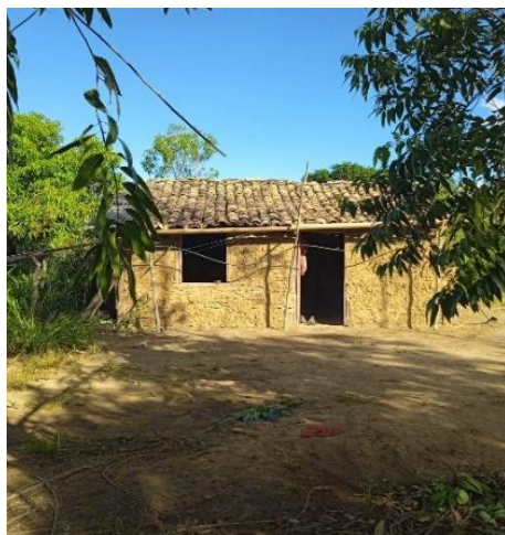
Figura 9: Casa histórica da comunidade Fazenda Estiva, feita de taipa e barro.

Além disso, a cobertura das residências, geralmente confeccionada com palha, contribuía para o agravamento dessa vulnerabilidade, facilitando o acesso desses animais ao interior das casas. Essas experiências revelam não apenas as limitações materiais enfrentadas pela comunidade em seus momentos iniciais, mas também as estratégias de adaptação e resistência construídas coletivamente ao longo do tempo. Nesse sentido, a habitação deve ser compreendida não apenas como estrutura física, mas como espaço social e simbólico, atravessado por relações de memória, pertencimento e luta por condições dignas de existência (Arruti; Munanga, 2006).