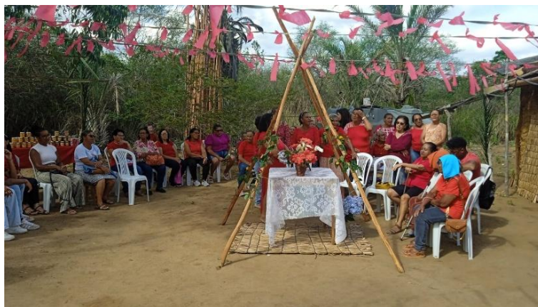
Figura 13: Retomada étnica da tradicional reza em homenagem a Santa Bárbara.

condução da pesquisa reforça os princípios da investigação participativa, em que todos os atores sociais envolvidos têm voz ativa nas decisões. Essa postura, segundo (Bhabha, 1998), possibilita um fechamento orgânico e significativo do processo investigativo, respeitando os tempos, rituais e dinâmicas próprias da comunidade.