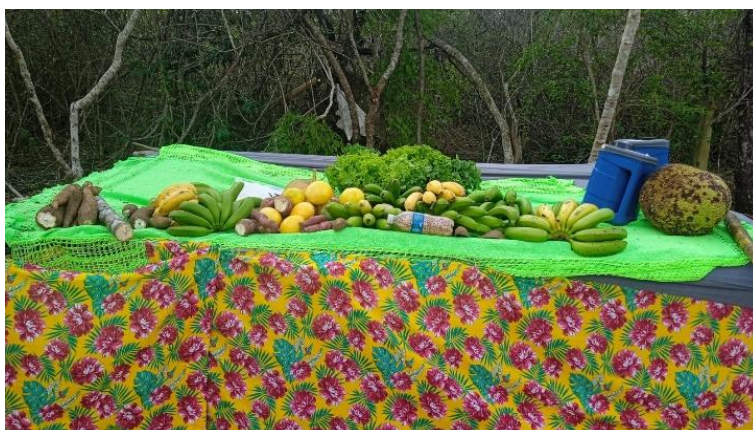
Figura 15: Produtos da agricultura familiar e de subsistência da comunidade Fazenda Estiva

Os complexos processos sociais e afetivos desencadeados após a conquista da liberdade por grupos sociais subalternizados (Oliveira; Peixoto, 2020). A partir de uma perspectiva subjetiva e enraizada no território, articula dois movimentos interdependentes: a diáspora interna pós-emancipação e a persistência dos laços comunitários por meio de práticas de reciprocidade intergeracional. Este processo era apresentado principalmente a partir da agricultura familiar e de subsistência. Na figura 15, são demonstrados os principais alimentos produzidos na comunidade Fazenda Estiva (Ribeiro, 2018).