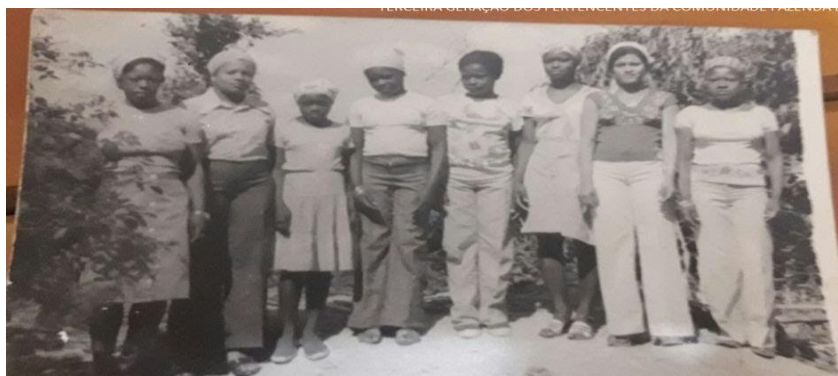
Figura 20: Reunião das mulheres no final do século XX para a elaboração da reza de Sant'Ana, padroeira da comunidade.

longo da história, destacando seu protagonismo em momentos decisivos para a comunidade. Na (fig. 20) é apresentado um grupo de mulheres no final do século XX em uma manifestação cultural da comunidade. Dessa forma, elas não apenas ocupam espaços de liderança, mas também redefinem as noções de poder e influência, desafiando estereótipos e promovendo uma visão mais inclusiva e equitativa da sociedade (Lima, 2014).