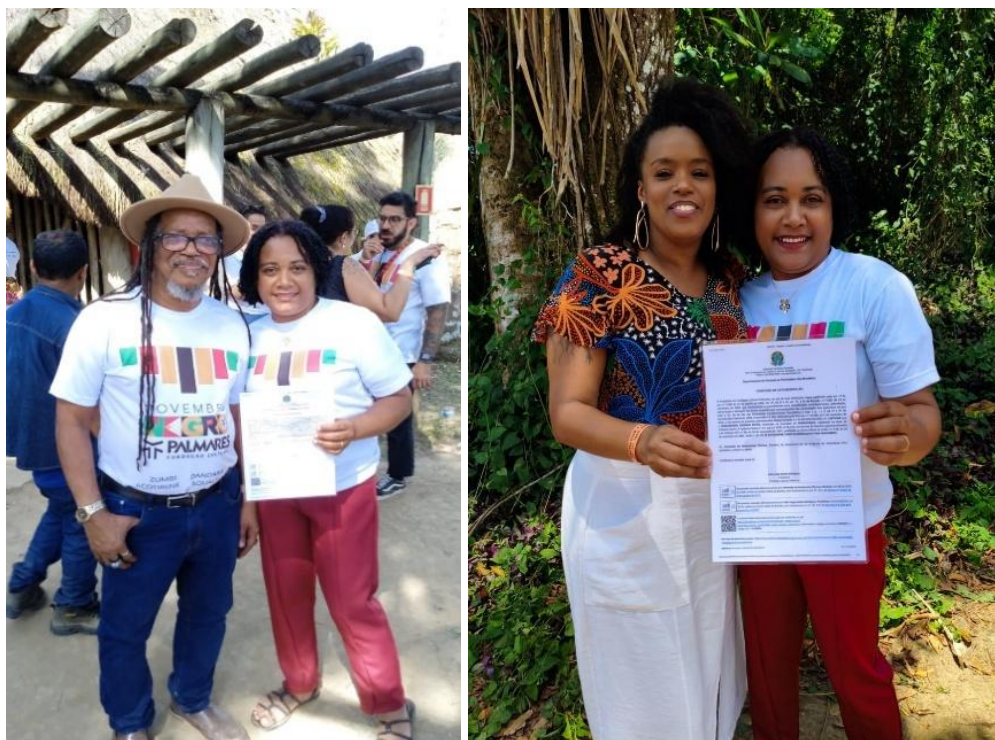
Figura 21: Cerimônia de certificação realizada em União dos Palmares, no território do Quilombo dos Palmares, em Alagoas.