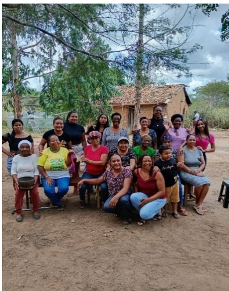
Figura 19: Reunião das mulheres da comunidade Fazenda Estiva para a elaboração das atividades culturais anual.