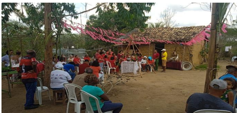
Figura 16: Manifestações culturais: Reza em homenagem a Santa Bárbara, na comunidade Fazenda Estiva

A comunidade Fazenda Estiva tem empreendido um esforço significativo para revitalizar suas manifestações matrizes. O samba de roda, expressão coreográfico-musical de profunda raiz afro-indígena, e as rezas aos santos de devoção, como apresentado na (fig. 16), que historicamente a consagraram como referência religiosa na região, são reatualizados não como folclore, mas como atos de sobrevivência cultural (Oliveira, 2017). Essa revitalização opera como um “dispositivo de memória” (Pollak, 1989), um meio de reatar os fios entre o passado e o presente, garantindo a continuidade do grupo.