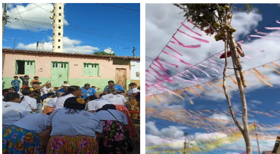
Figura 17: Manifestações culturais: Samba de roda e Levante do ramo na fogueira junina na comunidade do Cuscuz

As manifestações de samba de roda no Bairro do Cuscuz destacam-se como expressões culturais significativas na contemporaneidade. Realizadas no dia 13 de maio de 2024, essas práticas revelam a persistência e a ressignificação de tradições afro-brasileiras em contextos urbanos modernos (Bhabha, 1998). O samba de roda, reconhecido como Patrimônio Cultural Imaterial da Humanidade pela UNESCO, mantém sua relevância ao integrar elementos como música, dança e sociabilidade, reforçando identidades coletivas e promovendo a memória cultural. A escolha da data, coincidindo com o “Dia da Abolição da Escravatura no Brasil”, sugere uma conexão simbólica entre a manifestação artística e as lutas históricas por liberdade e reconhecimento (Braga, 1992).