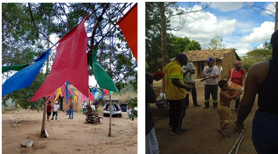
Figura 14: Preparação dos instrumentos musicais para o samba de roda na comunidade Fazenda Estiva

A importância da preservação das comunidades tradicionais inscreve-se não apenas na dimensão física do espaço, mas, sobretudo, nas narrativas coletivas que as constituem enquanto lugar de memória e identidade (Silva Filho, 2010). Tais comunidades frequentemente se consolidam como fruto de trajetórias históricas marcadas por resistência e luta pela posse da terra, cuja conquista, mesmo quando bem-sucedida, não garante a integridade permanente do território (Santana, 2022). Esse processo de perda espacial progressiva, comum a muitos grupos, resulta numa dissociação entre a memória do território original e a realidade geográfica contemporânea. Na figura 14, são apresentados momentos de preparação para as manifestações culturais da comunidade Fazenda Estiva com o tradicional samba de roda (Oliveira, 2012).