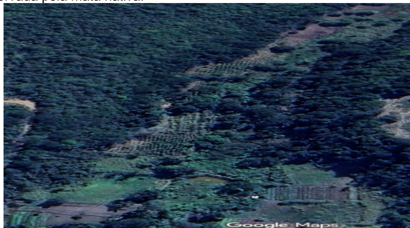
Figura 18: A parte central localiza-se o cultivo agrícola e do lado direito encontra-se a Toca do Nagô, preservada pela mata nativa.