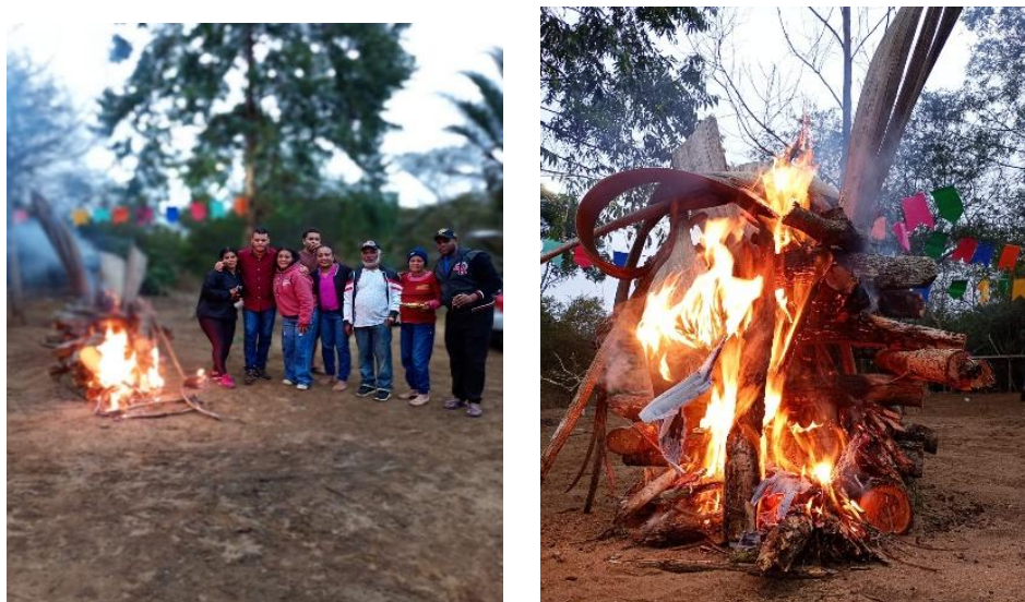
Figura 11: Festejo junino com tradicional fogueira realizada na comunidade Fazenda Estiva.

juninas, como caldos, milho assado, bolos de puba, biscoito doce. Como descrevem (Da Silva; Gomes, 2023) em seus estudos sobre patrimônio cultural popular, as festividades configuram-se como elemento central desse ritual coletivo, simbolizando não apenas o aquecimento dos corpos, mas também o reavivamento dos laços comunitários. A presença marcante de música, dança e comidas típicas, conforme analisa (DaMatta, 1979), recria o ambiente festivo de outrora, permitindo a transmissão intergeracional de práticas culturais essenciais para a manutenção da identidade grupal.