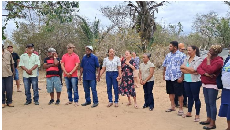
Figura 12: Tradicional reza de Nossa senhora Sant'Ana na comunidade Fazenda Estiva

e santa de devoção ancestral profundamente enraizada na identidade comunitária, como apresentado na figura 12. Como destacam (Bassi; Tavares, 2017), as festividades religiosas tradicionais representam momentos cruciais de revitalização cultural, em que práticas coletivas de fé se entrelaçam com a preservação da memória social.