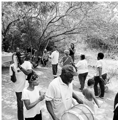
Figura 10: Tradicional samba de roda da comunidade Fazenda Estiva

da Prefeitura Municipal de Maracás, que disponibilizou transporte, foi possível levar um grupo maior de participantes até a comunidade, facilitando a inclusão de diversos atores sociais no processo investigativo. Como destaca (Minayo, 2014), a flexibilização dos formatos e tempos de pesquisa, atendendo às demandas da comunidade, é essencial para uma abordagem etnográfica verdadeiramente colaborativa. Esse encontro interno, que contemplou a revitalização do tradicional samba de roda apresentado na (fig. 10), resultou em um processo tão significativo para a comunidade Fazenda Estiva que será implantado no calendário cultural do espaço anualmente nessa mesma data.