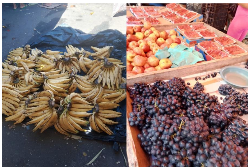
Figura 2 - Banana, uva e maçã