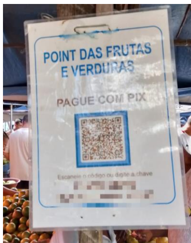
Figura 8 - Plaquinha indicando Chave Pix