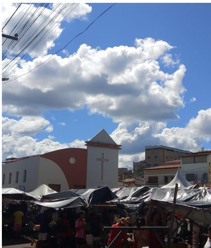
Figura 7 - Paróquia São Francisco de Assis, Joaquim Romão, Jequié-BA