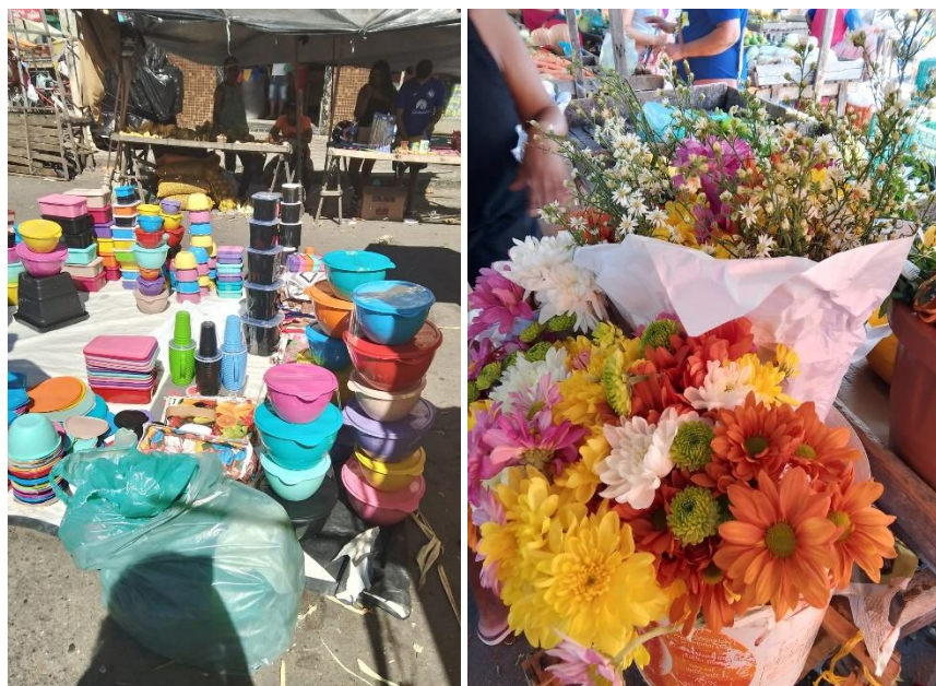
Figura 5 - Vasilhas plásticas e flores