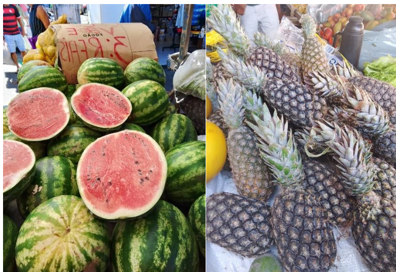
Figura 1 - Melancia e Abacaxi