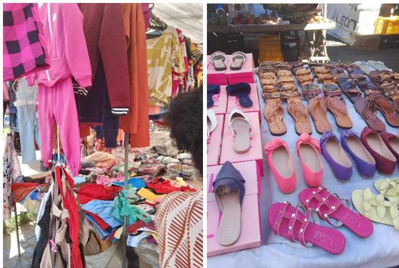
Figura 3 - Roupas e calçados