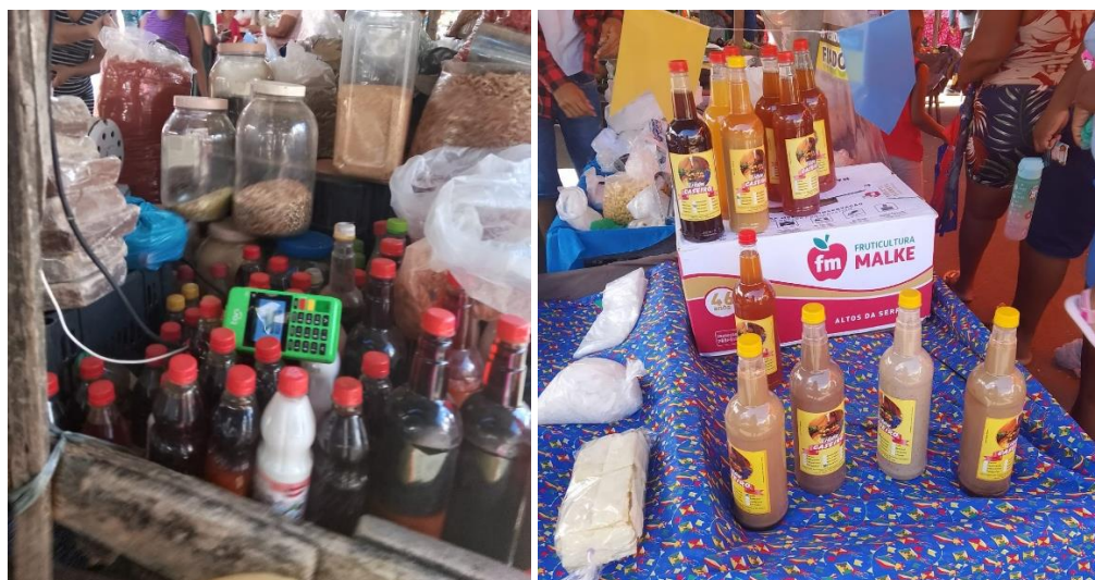
Figura 4 - Temperos, dendê e licor