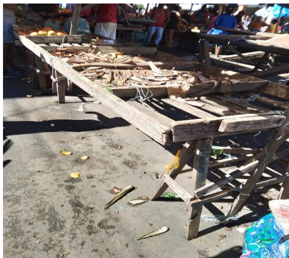
Figura 6 - Barraca de madeira na Feirinha