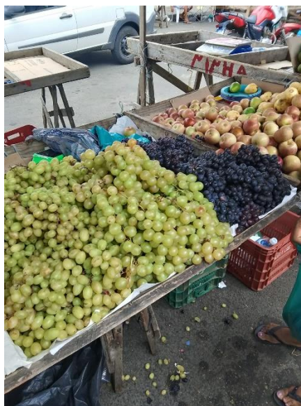
Figura 9 - Barraca de Quitéria na Feirinha do Joaquim Romão