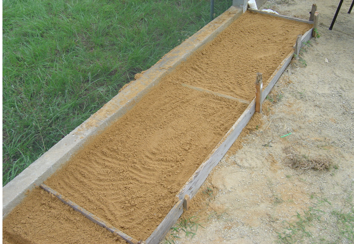
Figura 1.1 – Canteiros de areia onde foram plantadas as sementes para germinação.

nitrogênio, fósforo e potássio foram uréia, superfosfato simples e cloreto de potássio, respectivamente.