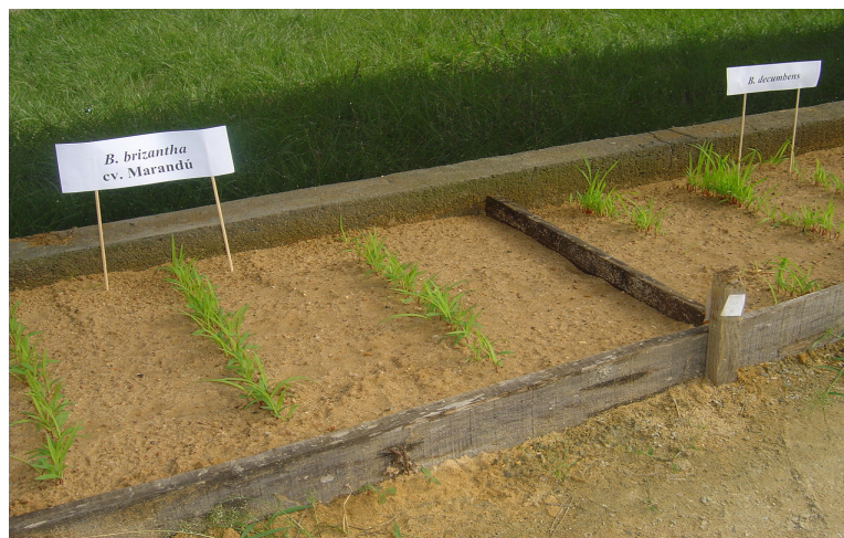
Figura 1.2 – Plântulas a serem utilizadas nos tratamentos experimentais.