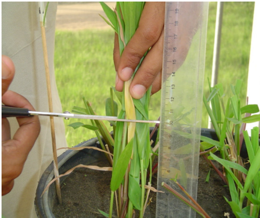
Figura 1.5: Detalhe do uso da régua milimetrada para as mensurações e alturas de corte.

Para o estudo das características morfogênicas e estruturais, utilizou-se um perfilho por planta, sendo quatro perfilhos marcados em cada uma das 40 unidades experimentais, identificados com fios de lã coloridos. As plantas eram irrigadas em dias alternados com 500 a 1000 mL de água para cada vaso, sendo correspondente a maior quantidade para os vasos que receberam tratamentos com N, dependendo da temperatura diária. A necessidade de água pelas plantas foi avaliada visualmente. As medições foram feitas a cada três dias, durante todo o período experimental de 28 dias. Em cada perfilho marcado foram realizadas, com régua milimetrada (Figura 1.5) de 50 cm, as mensurações, sendo identificadas às novas folhas e registrado o aparecimento do ápice foliar, o dia de exposição da lígula, o comprimento do pseudocolmo, o comprimento da lâmina foliar expandida e o comprimento da lâmina foliar em expansão. Neste estudo foram avaliados aspectos relativos às características morfogênicas (taxa de aparecimento foliar, filocrono, taxa de alongamento foliar e duração de vida da folha) e estruturais (comprimento do pseudocolmo, comprimento final da folha, número total de folhas, número de folhas em senescência, número de folhas mortas, altura máxima da planta, número de perfilhos por planta, número de perfilhos por vaso e peso médio do perfilho).