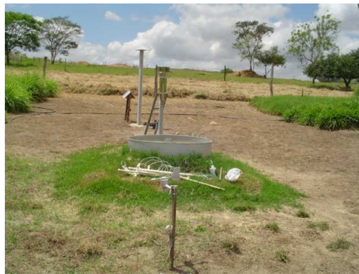
Figura 5 – Aparelhos meteorológicos.