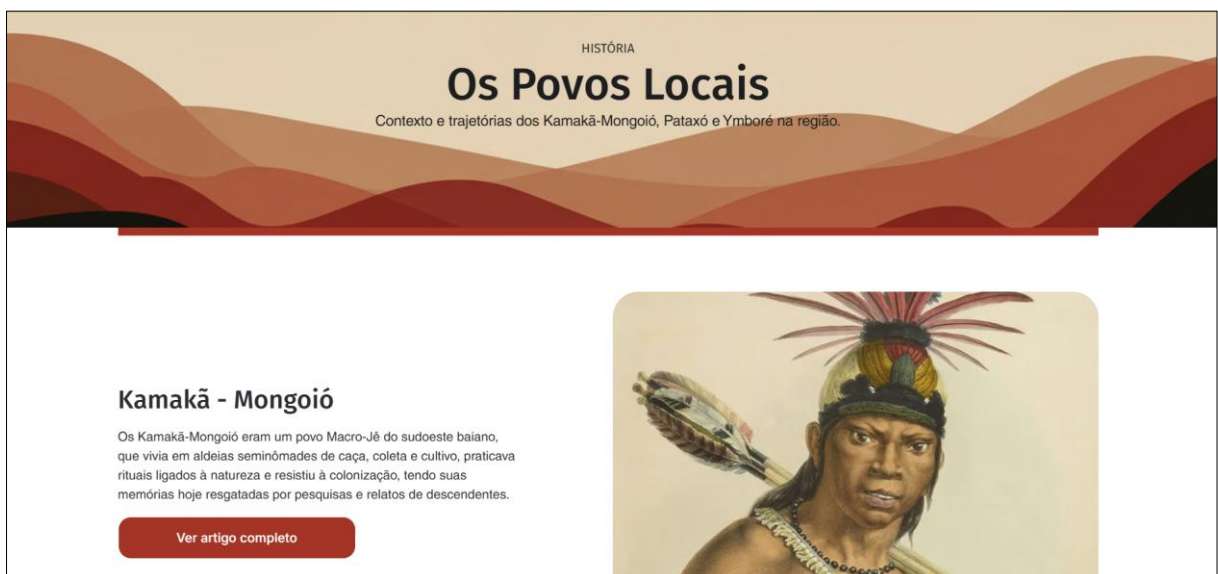
Figura 2 – Página com atividade de leitura no site

Visando ser integrado ao planejamento didático das aulas de História regional, o site apresenta seções organizadas para contemplar as competências e habilidades previstas na BNCC, com atividades didáticas de leitura e pesquisa, por exemplo.