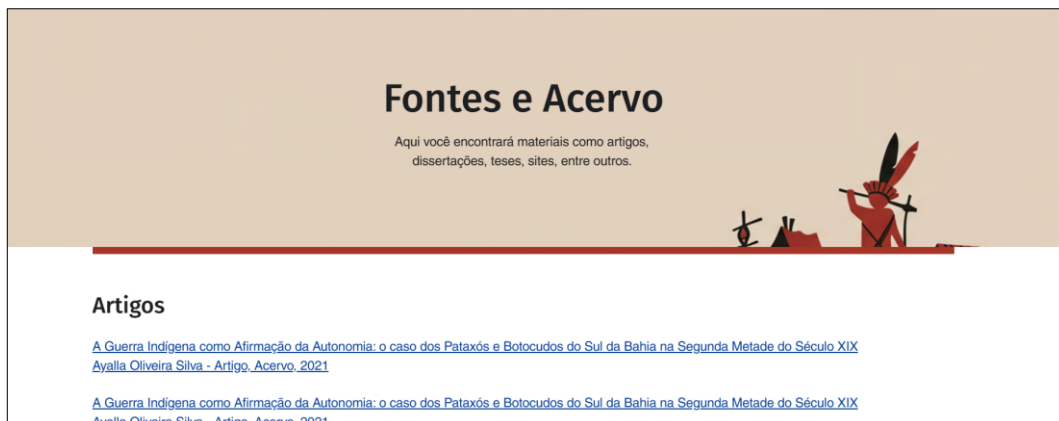
Figura 6 - Página Fontes & Acervo