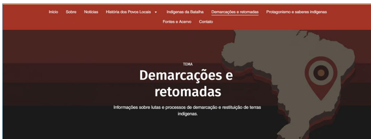
Figura 3 – Seção dedicada a Demarcações e Retomadas

Conforme já discutido neste projeto, por estar vinculado à dissertação de mestrado que o fundamenta, o site está em consonância com as diretrizes estaduais para a educação indígena.