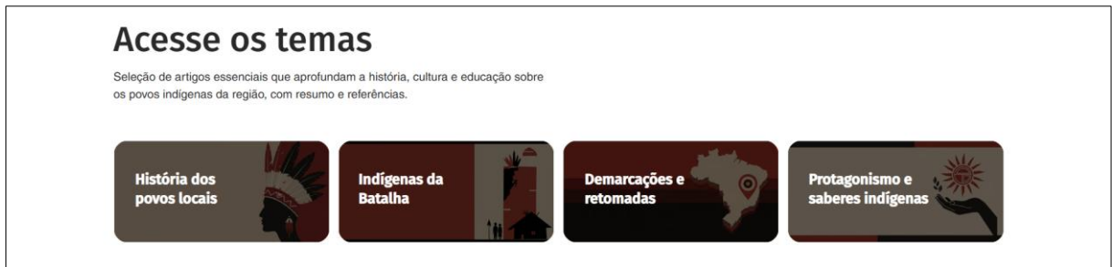
Figura 7 - Menu com os temas abarcados pelo site

Elementos decorativos sutis, inspirados em padrões gráficos de tradições indígenas, foram aplicados em alguns blocos de texto. O site é responsivo e acessível, adaptando-se automaticamente a diferentes dispositivos.