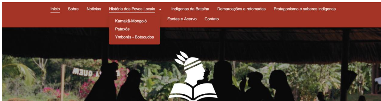
Figura 5 - Menu do site

O site foi construído com uma navegação principal fixa no topo, facilitando o acesso aos diferentes conteúdos. O menu hierarquizado contempla as seguintes páginas: “Início”, “Sobre”, “História dos Povos” (subdividida por etnias), “Notícias”, “Demarcações e Retomadas”, “Protagonismo e Saberes Indígenas”, “Indígenas da Batalha”, “Fontes & Acervo” e “Contato”.