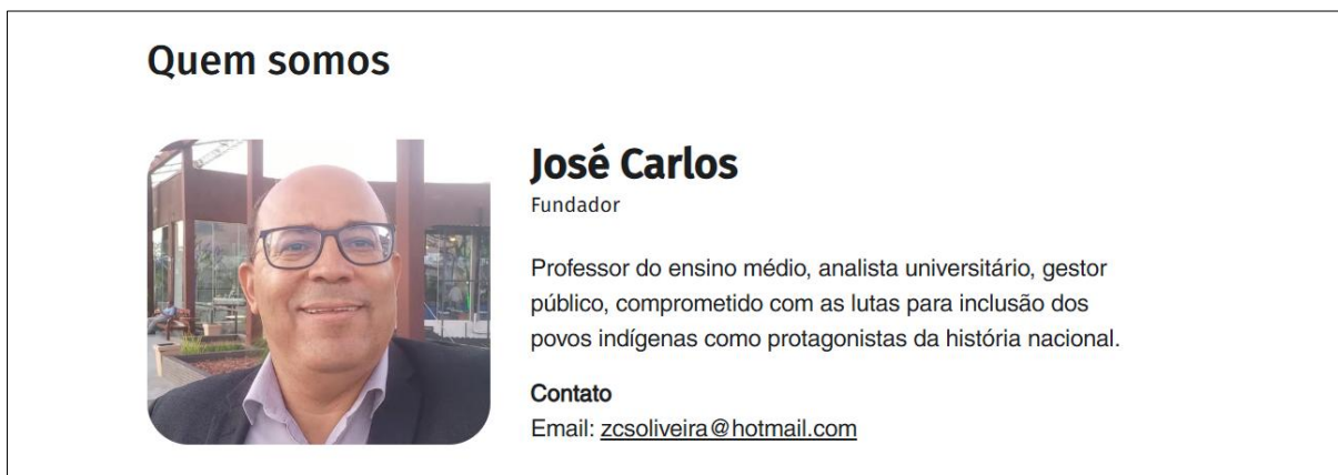
Figura 8 – Contato