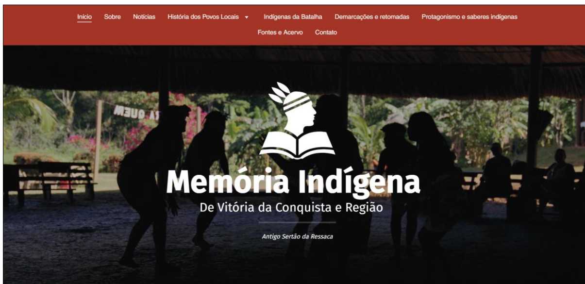
Figura 1 – Página inicial do site Memória Indígena de Vitória da Conquista e Região